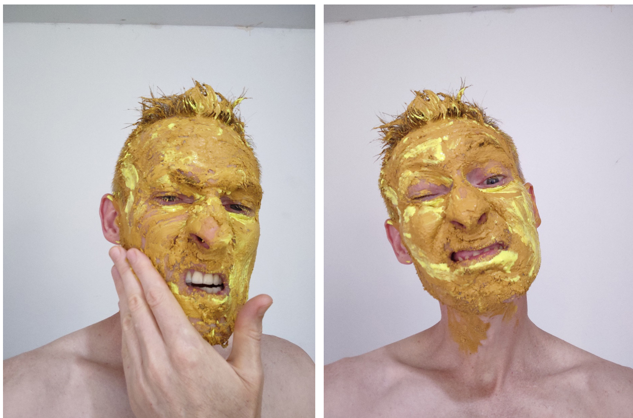
Rogério Schraiber. Fotografia, 2024. Fonte: elaborado pelo autor