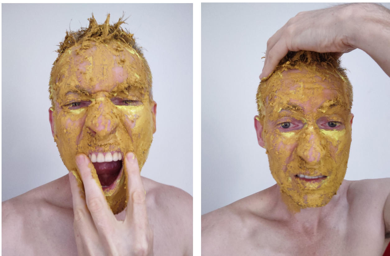
Rogério Schraiber. Fotografia, 2024.