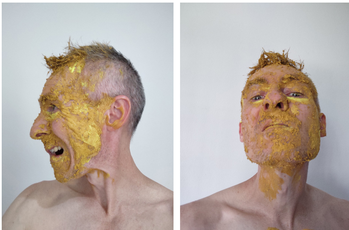
Rogério Schraiber. Fotografia, 2024. Fonte: elaborado pelo autor.