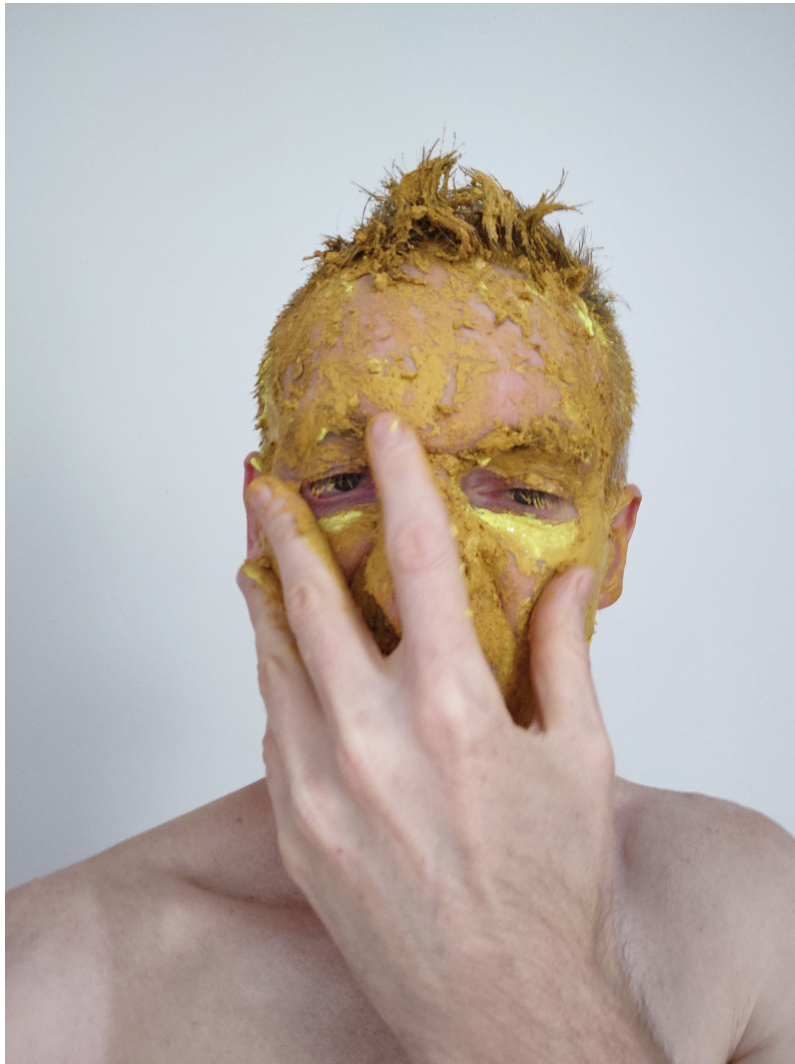
Rogério Schraiber. Fotografia, 2024. Fonte: elaborado pelo autor