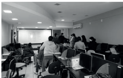
Figura 02 - Foto do jogo da memória

Nos últimos encontros, mais precisamente, nos dois encontros que precederam a entrega de certificado, foram marcadas, respectivamente, a entrega de notas, provas e as respectivas correções, e a troca de presentes de um amigo secreto. No dia do amigo secreto, todos compartilhariam lanches trazidos sem compromisso. Todos levaram lanches, a mesa ficou repleta de doces, salgados, frutas, refrigerantes, sucos e chás. A troca de presentes foi animada e rendeu muitas risadas. Depois do amigo secreto, a turma decidiu contar piadas, quando acabou o repertório de todos e ainda havia tempo, o professor sugeriu uma brincadeira chamada “o jogo da memória”. Tratava de memorizar a sequência de toques nos objetos e repeti-las na ordem correta. O primeiro participante tocou no computador, o segundo no computador e na cadeira e, assim, chegarem a mais de 30 toques. O vencedor da brincadeira foi o professor. A Figura 02 é uma foto do jogo da memória.