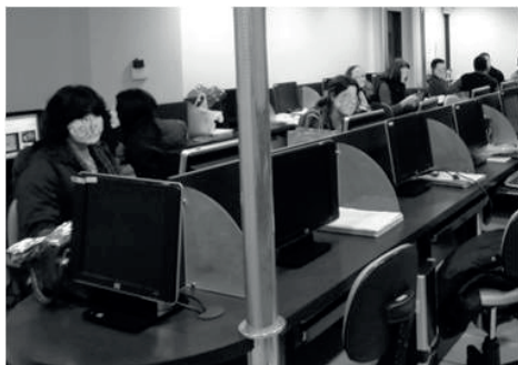
Figura 01 - Foto de sala de aula