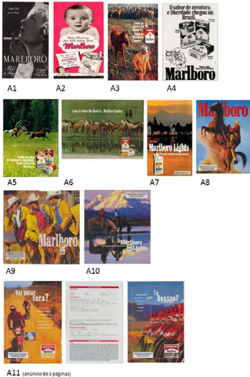
Figura 2 – Exemplos analisados