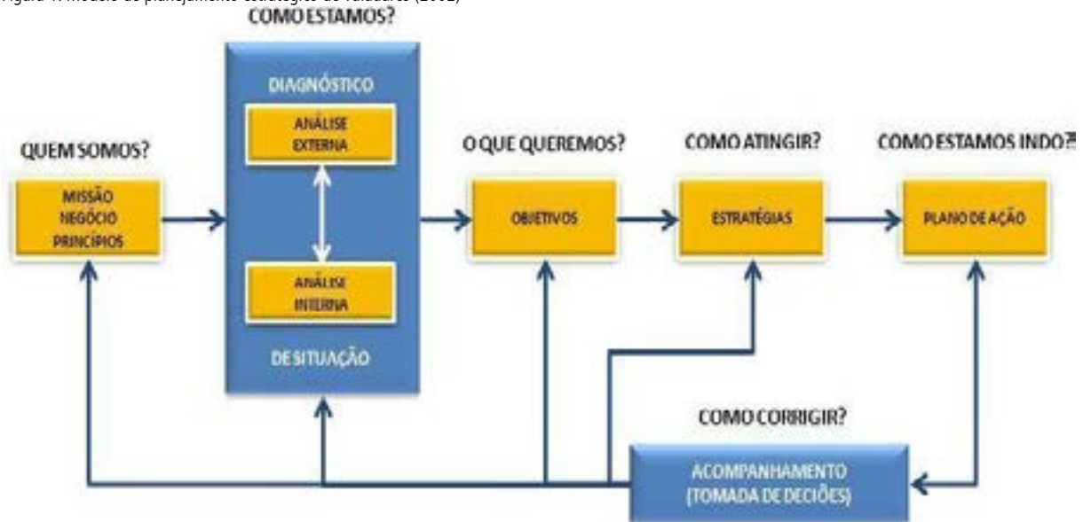
Figura 1: Modelo de planejamento estratégico de Valadares (2002)