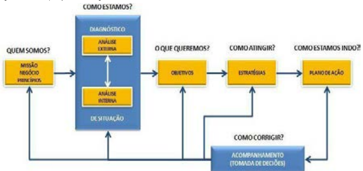
Figura 3: Modelo de planejamento estratégico de Valadares (2002)