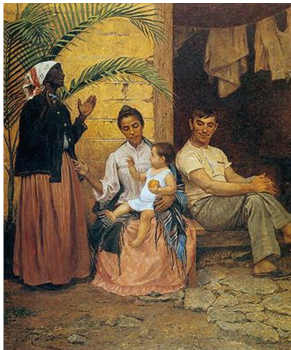
Figura II: A redenção de Cam, de Modesto Brocos, 1895