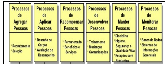
Figura 1 - Modelo de diagnóstico de gestão de pessoas