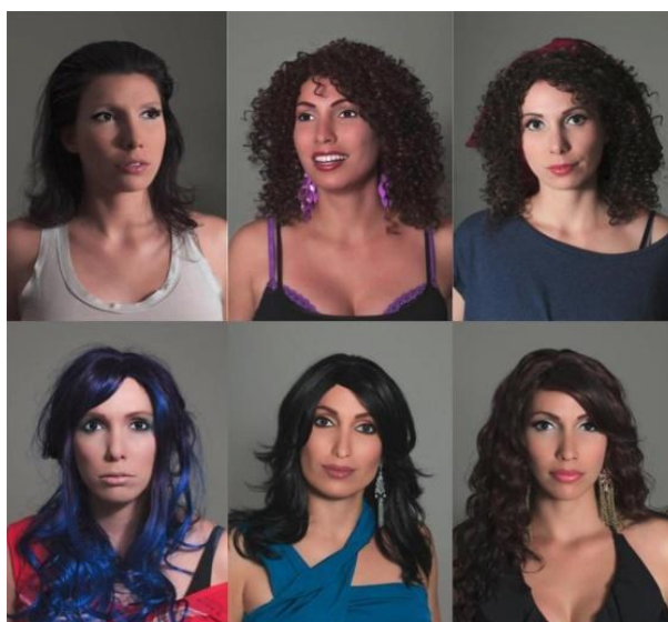
Figura 1: Born Nowhere , Laís Pontes, 2011.

Posteriormente, foi apresentada a minibiografia de cada personagem, conforme consta no trabalho da artista, dados obtidos a partir de colaboradores do projeto por meio de uma mídia social. Na construção dos alunos predominou um consenso em relação a questões gerais, como nacionalidade e profissão, mas houve discrepância de opinião na definição de aspectos subjetivos, como orientação sexual, hábitos e gosto pessoal.