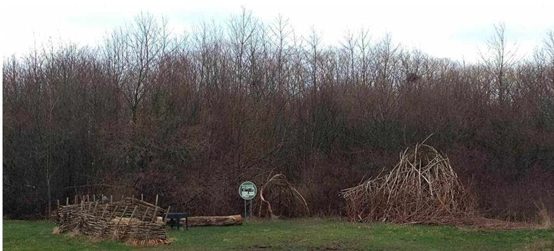
Figura 7: Outras arquiteturas, mas iguais.

As crianças também ficam fascinadas com a estética da sombra, chamando a professora para se deleitar nessa experiência. Para elas, este mundo mágico de luz, de sombras, de efeitos do sol, da natureza é visto como uma arquitetura da luz que incide nos suportes e pode provocar/causar a sensação de espaço brincante, de luz e espaço inseparáveis. Tendo em vista que a luz invade e define os contornos, tornando visíveis e perceptíveis os espaços e os objetos com os quais as crianças entram em contato, torna-se marcante a presença e as relações. “O mundo não foi feito em alfabeto. Senão que primeiro em água e luz. Depois árvore” (BARROS, 2000, s.p).