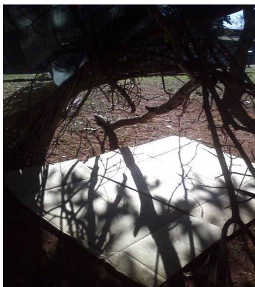
Figura 4: Luz e Sombra.