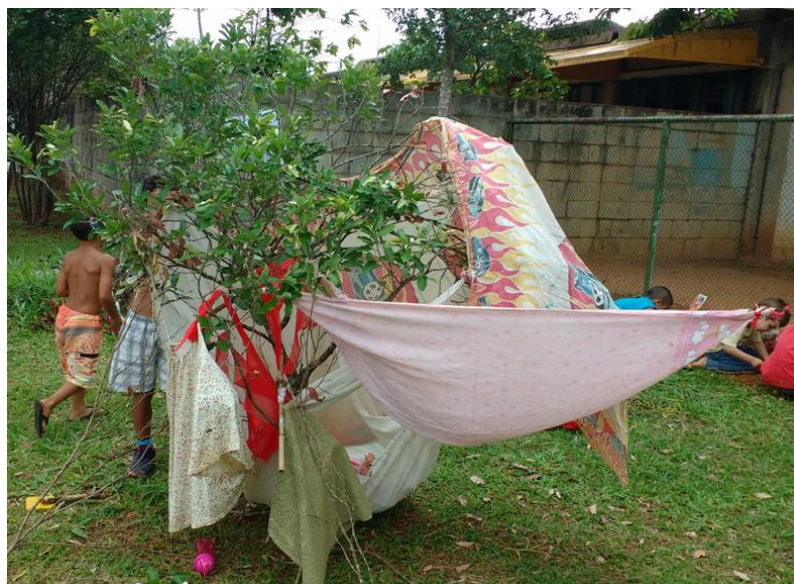
Figura 10: Instalação.

A cabana como instalação nos espaços e tempos da educação infantil se lança como propositura de outro olhar para o processo de criação entre crianças e adultos, de pensares sobre a relação entre os objetos, materialidades, as sensações, os sentidos, o planejar para e com as crianças, demarcando possibilidades de um currículo cabanas na educação infantil. Essa arquitetura do brincar que permeia nessa entidade aparentemente imaterial define-se como um jogo repleto de significados, de sensações e de mensagens.