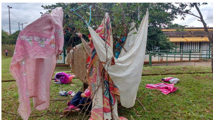
Figura 9: Instalação.

Na instalação artística, os objetos são dispostos no espaço, ressignificando lugares e proporcionando experiências sensoriais ao público. Diante das cabanas nos espaços da