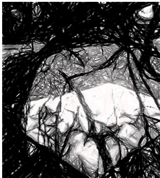
Figura 6: Desenho das Sombras.

Chove torto no vão das árvores. Chove nos pássaros e nas pedras. O rio ficou de pé e me olha pelos vidros. Alcanço com as mãos o cheiro dos telhados. Crianças fugindo das águas. Se esconderam na casa. (BARROS, Manoel, 2015, s/p.)