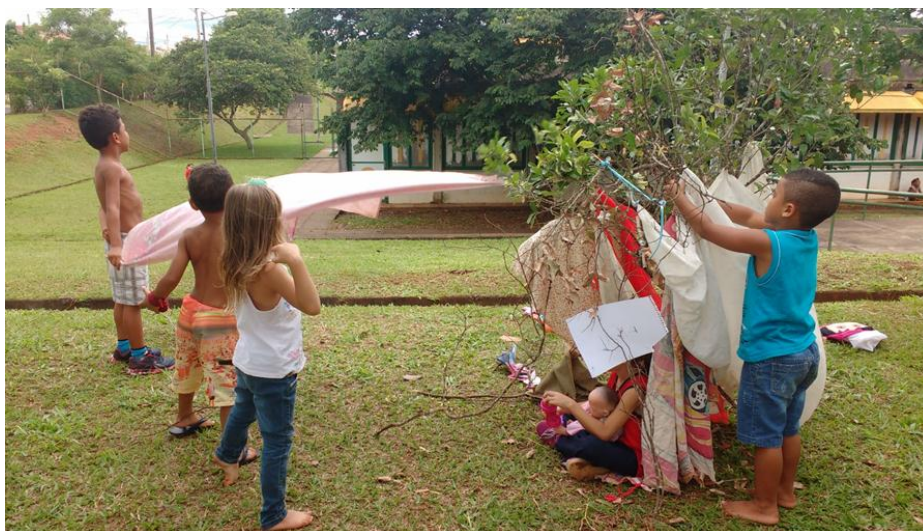
Figura 3: Arranjos.