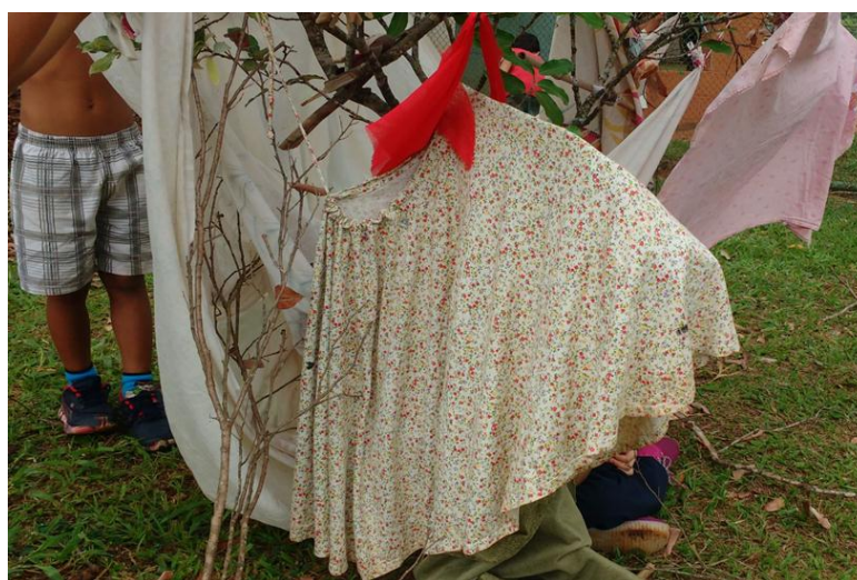
Figura 8: Instalação.