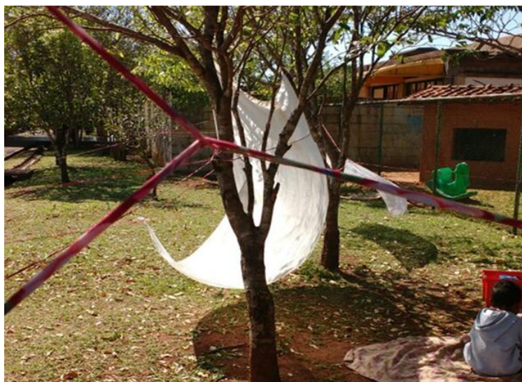
Figura 2: Vento na Cabana.