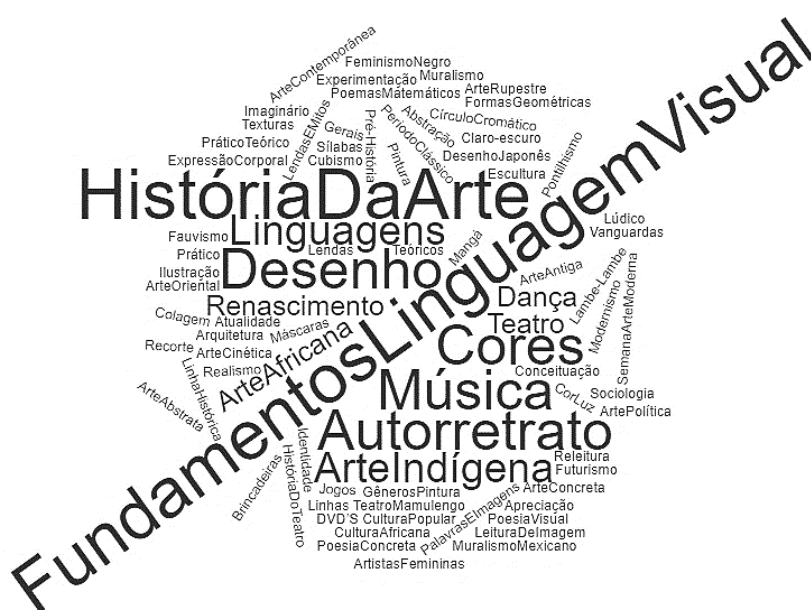
Figura 2: Nuvem 'conteúdos abordados', segundo falas dos docentes

necessidade de potencializar outro modo de ser professor, que fuja desse modelo enraizado em nossa "pele pedagógica" ( idem , p. 187).