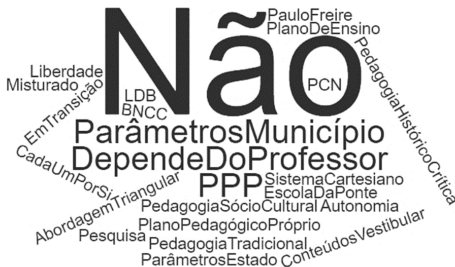
Figura 4: Nuvem 'orientação pedagógica oferecida pela instituição', segundo os docentes

Com a sétima pergunta – ou a segunda pergunta voltada à escola –, procurou-se investigar o número de professores de Arte atuantes em cada instituição, bem como a quantidade e o tipo de linguagens da arte ofertadas.