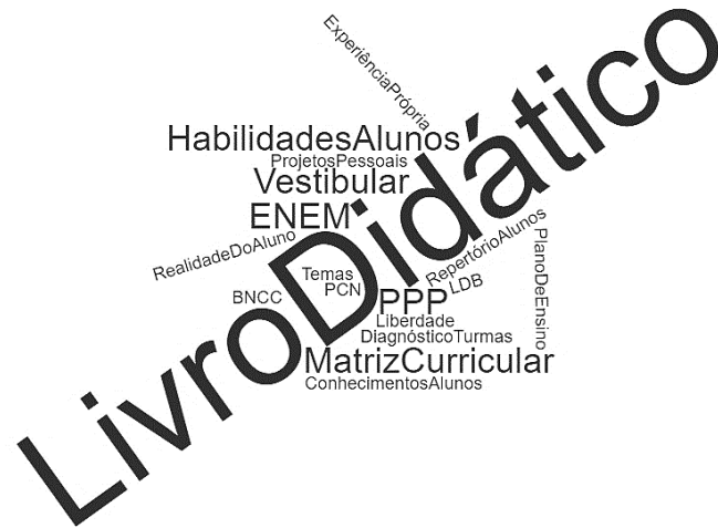
Figura 1: Nuvem 'modo de escolha dos conteúdos', segundo falas dos docentes

Exames classificatórios e documentos como o Projeto Político Pedagógico e os Parâmetros Curriculares Nacionais também apareceram nas falas dos docentes (Figura 1).