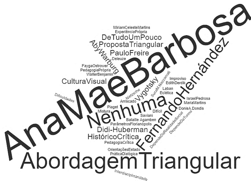
Figura 3: Nuvem 'teoria ou linha pedagógica adotada', segundo falas dos docentes

Evidenciam-se nas respostas as confusões em torno das linhas pedagógicas que envolvem os fazeres docentes. Toda educação é orientada por uma determinada concepção pedagógica e filosófica que ordena e direciona a prática docente; entretanto, as pistas indicam que os professores não têm a noção exata dessa dimensão em seus fazeres. Muitas vezes, não percebem “[...] que esse direcionamento diário inconsciente pode decorrer de massificação, do senso comum, que adquirimos e acumulamos espontaneamente” (LUCESI, 1994, p. 24).