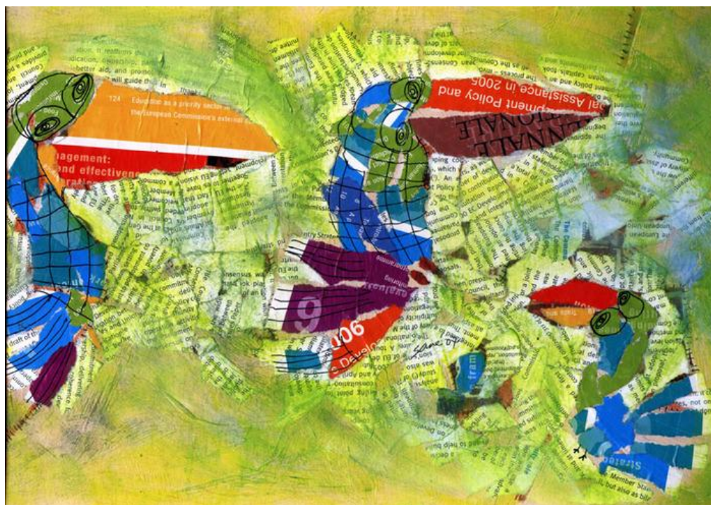
Figura 1: Obra de Eria Nsubuga (Uganda), Título: "A personalidade dos pássaros ". 2011, Colagens e técnica mista, Aprox. 38 x 42 cm.