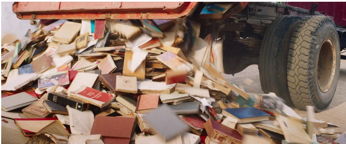
Figura 3: Caminhonete despejando os livros