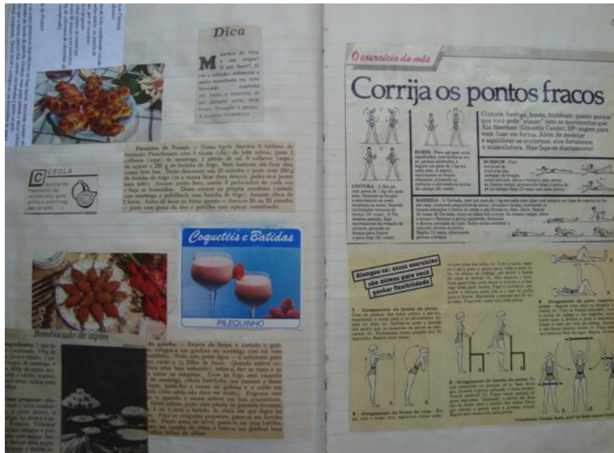
Fig. 1 - Imagem de páginas do caderno de receitas da minha mãe

elementos que abriga em suas páginas, outras mulheres que só se sentiam seguras para manifestarem-se naquele local/objeto.