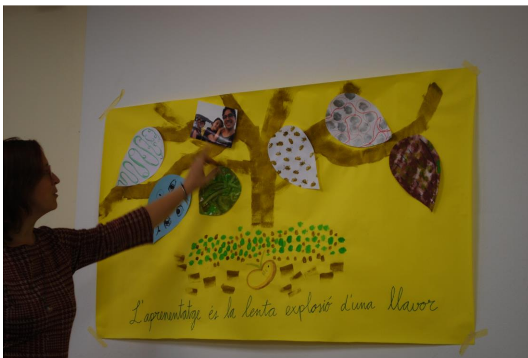
Figura 05. Mar presentando su cartografía.

Me di cuenta de que cojo también palabras vuestras, que estoy aprendiendo y pienso: son conversaciones, son movimientos, son momentos de compartir, donde se crean momentos únicos que nos hacen saltar, nos hacen como saltar de nivel e ir progresando. Las abejas (en su cartografía) supongo que tienen un movimiento, se relacionan, se comunican, informan, tienen toda una serie de códigos ... Pensé que yo en espacios así de iguales ... muy importante fue el espacio, de estar a un 'esplai', de hecho, fundamos uno. Yo estaba en el de jóvenes y fundamos el de pequeños y fue un lugar de crecimiento brutal, entre iguales, entre mis amigos y compañeros, y entre los chicos que también estaban.