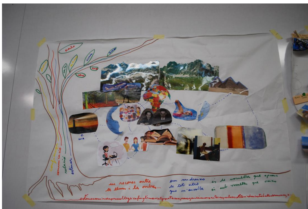
Figura 01. La cartografía de Carmina.

Y es que el afecto no es una fuerza que esté aislada, sino que es transversal ya que cruza todas las dimensiones del conocimiento, del sujeto como individuo y de la realidad. Además, implica un cambio sustancial en las relaciones en torno a la política, la investigación y la pedagogía. Pues afecto es “lo que separa al hombre dueño de sí del esclavo es la capacidad para transformar [...] efectivamente, solo un afecto más potente vence a otro afecto más inmediato y tentador” (CAMPS, 2011, p. 86-87).