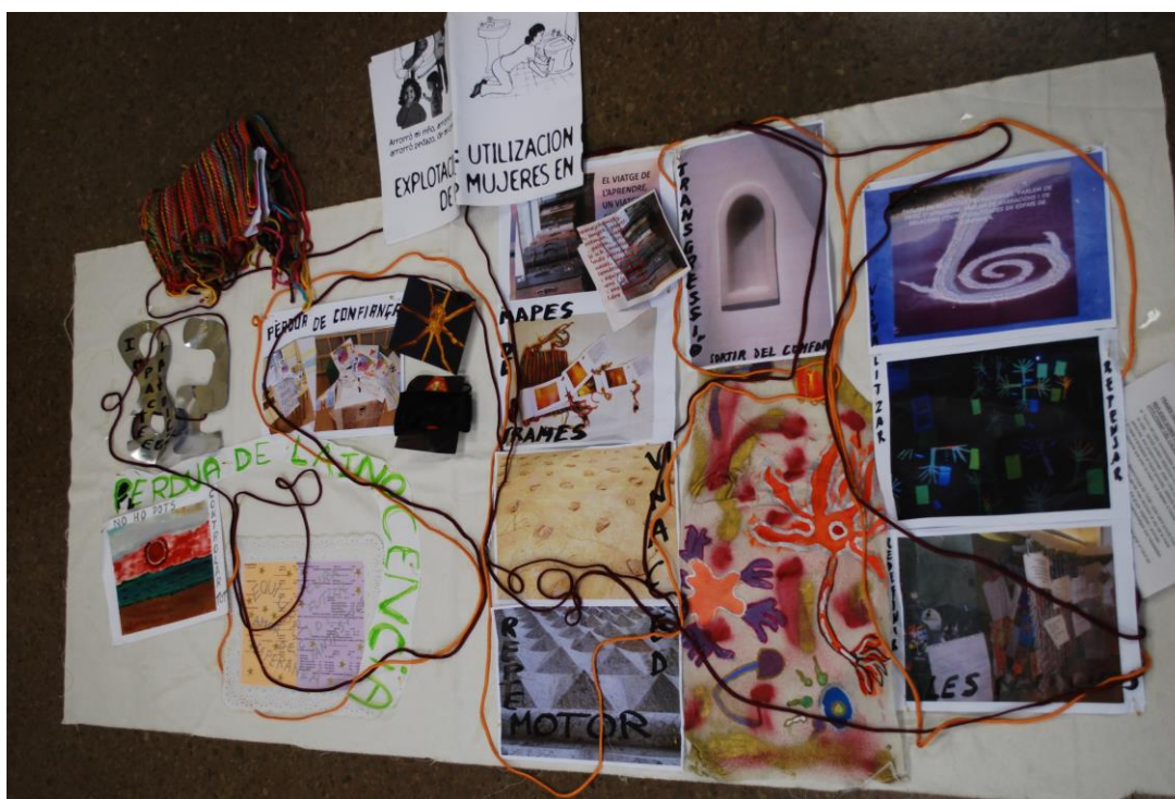
Figura 02. La cartografía de Ita.

para romper ideas estereotipadas, para romper la utilización de imágenes estereotipadas y para romper la idea de prácticas estereotipadas con los niños.