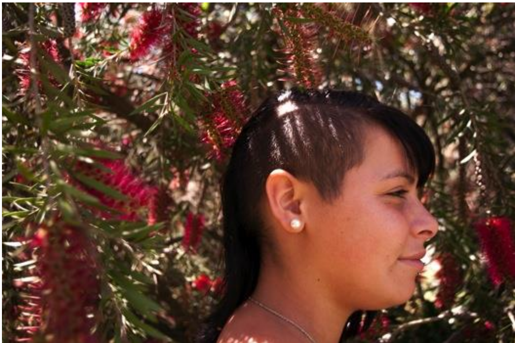
Figura 06. Perfil de los estudiantes