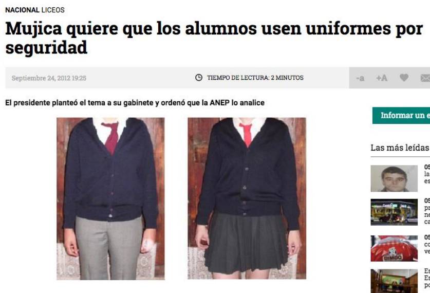
Figura 01. Artículo de prensa en periódico de circulación en Montevideo.

marca Akme, o Informes Institucionales como la "Encuesta Nacional de Adolescencia y Juventud. Constitución del hogar, empleo y actividad física." 4