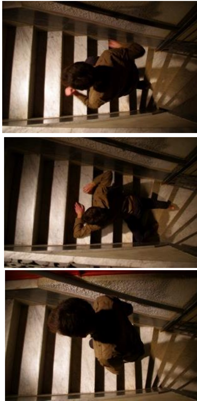
Figura 03. Escalera del Centro de Estudios

La próxima imagen es de Sara y se inscribe en su modalidad de presentación y de participación dentro del proceso de trabajo. Tomó su voz y su expresión como eje inesperado para el dispositivo, provocando el debate con comentarios y preguntas. Cantó en tres oportunidades a lo largo de los encuentros. Canciones melódicas, que sus compañeros tarareaban y aprobaban, formando parte entusiasta del clima generado.