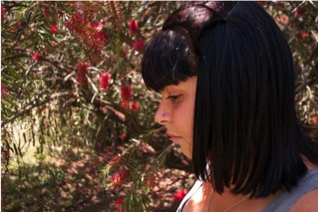
Figura 05. Perfil de los estudiantes