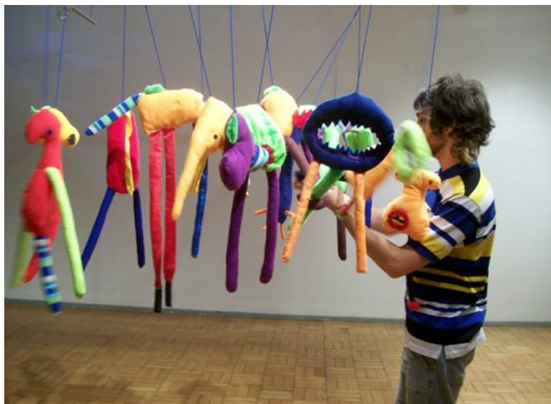
Figura. 02 Prazer.

Porém, logo depois comecei a pensar que eu estaria limitando a pesquisa e os próprios alunos a entrarem em contato com obras que não trazem palavras impressas, coladas, bordadas, pintadas, etc. Resolvi repensar, então. Do mesmo modo que meu projeto estava se modificando, meu trabalho artístico também estava tomando outros rumos, ganhando o espaço e necessitando da participação tátil do público. Assim, andando juntos, ambos trabalhos ganharam novas páginas e assumiram novas posições. Meus objetos explorando cada vez mais o envolvimento corporal das pessoas e meu projeto de estágio abordando os cinco sentidos nas artes visuais.