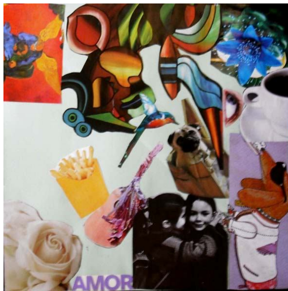
Figura. 04 Colagem 2