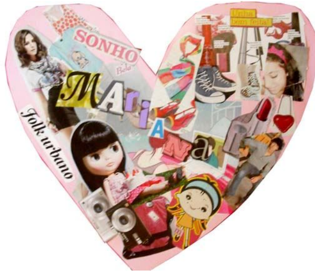
Figura. 03 Colagem 1

Em uma aula seguinte, levei cartolinas coloridas, tesouras, colas e revistas e propus que criassem um “Quem sou eu?” ou “Como eu me vejo?”, “Do que eu gosto?” explorando o papel (suporte), as imagens e palavras das revistas. Foi, sem dúvida, a primeira vez com essa turma que a proposição artística foi aceita e produzida com vontade, talvez pela necessidade que os adolescentes sentem de se posicionarem na sociedade, de possuírem uma identidade e de exibirem-na como assim acontece em redes sociais na internet.