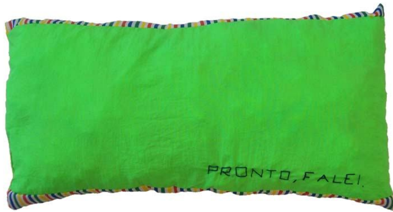
Figura. 01 Pronto, falei.