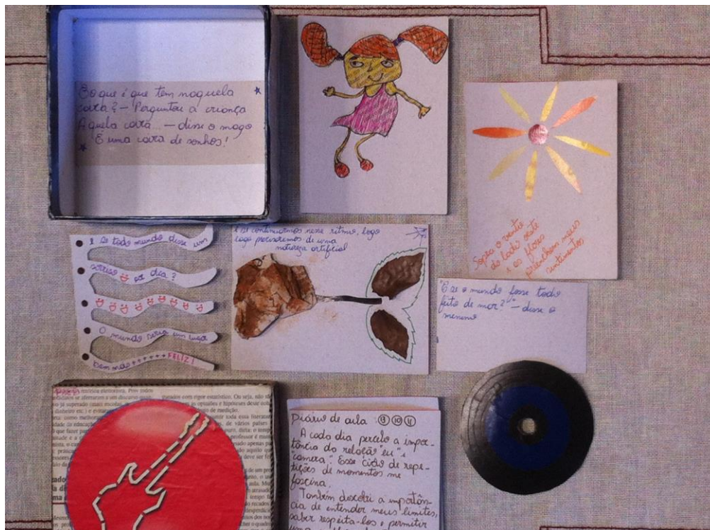
Figura 01: Diário de Maria José