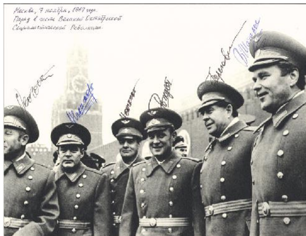
Figura.06: A descoberta histórica de Fontcuberta, ou seja, a inserção de uma imagem sua numa fotografia documental.

Com imagens assim, Fontcuberta nos dá várias pistas para que haja dúvida quanto à origem das fotografias. Provoca, ainda, a desconfiança diante de imagens que se apoiam em objetos e documentos "históricos". A convicção do espectador diante dessas fotografias parte da premissa de que elas são possivelmente documentais e, portanto, persuasivas e objetivas. O fotógrafo, ao inserir fotomontagens nesse contexto, cria falsas polêmicas, desafiando a crença do espectador na história da manipulação das fotografias soviéticas. Para Fontcuberta a ideia é resgatar o ceticismo do espectador diante de imagens que se passam por fidedignas e que estão inseridas não somente em exposições com esse