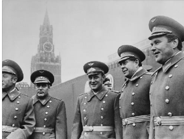
Figura.05: Leonov, Nikolayev, Rohzhdestvensky, Beregovoi e Shatalov, 1997.