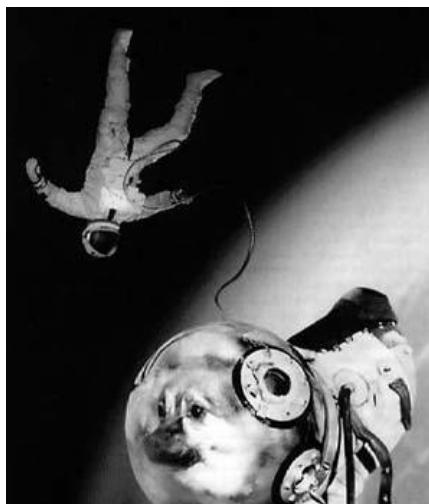
Figura.02: Ivan e um cachorro numa atividade extraveicular.

As fotografias são manipuladas digitalmente, como afirma o fotógrafo em uma conferência na Espanha, e muitas delas são claramente fotomontagens. Como a fotografia do astronauta com um cachorro em órbita (Figura 2) e a imagem onde uma garrafa de vodka passeia pelo espaço com uma mensagem dentro (Figura 3), visualidades estas que se tornam duvidosas, mas que se apoiam em imagens que parecem representar fielmente um documento (Figura 4):