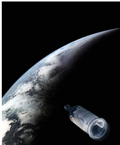
Figura.03: Uma mensagem em uma garrafa de vodka vaga pelo espaço.

Algumas fotomontagens e desconstruções imagéticas parecem ser fotografias documentais sem causar estranhamentos: