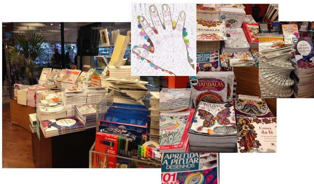
Figura 02. Para colorir. Foto-ensaio composto por 7 fotografias e um desenho de Emanuel dos Santos a partir de uma estrutura.

Superposição, transparências, a pintura do fundo e não das formas, teriam sido experimentadas?