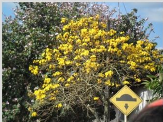
Imagem produzida durante a caminhada fotográfica