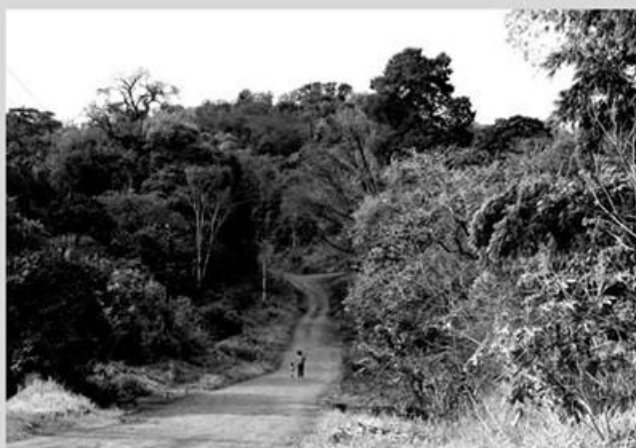
Imagem produzida durante a caminhada Fotográfica