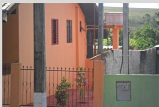
Imagem produzida durante a caminhada fotográfica