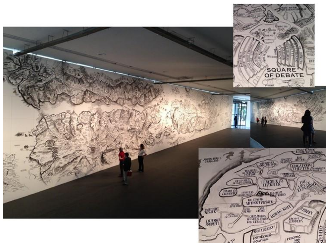
Figura 03. Mapa de Qiu Zhijie na 31ª Bienal de São Paulo. Foto-ensaio composto por 4 fotografias.

Destaco entre tantas possibilidades de leitura dois “lugares”. No primeiro deles, a Praça do Debate. Nela, arquibancadas opostas descrevem atitudes. Por um lado: habilidade de escuta, conte-me mais, fale com fundamento, diga com sensatez, expresse sua opinião para torna-la plausível, faça sentido, acordo. De outro: duvide, critique, discuta, discuta com fundamento, reconsidere, aceite e convença. Praça de múltiplos pontos de vista que compartilham ideias sem aceites superficiais, convocando a escuta e a problematização para chegar a acordos?