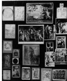
Figura 3 – Parte do painel de Aby Warburg

imagens, presas a ecrãs com pinças manipuláveis, abrem intervalos no fundo negro que não é só uma superfície onde se dispõe o quebra-cabeças, mas é parte do próprio. Didi-Huberman (2013, p. 496) vê esse intervalo negro como servindo de “fundo e de passagem” às imagens entre elas – ele é o “meio das imagens, uma atmosfera visual” que se reflete nelas. É a “armadura visual” da montagem, o tecido engendra as ligações entre as diferentes imagens - com todos os esquecimentos e inconscientes que também as determinam.