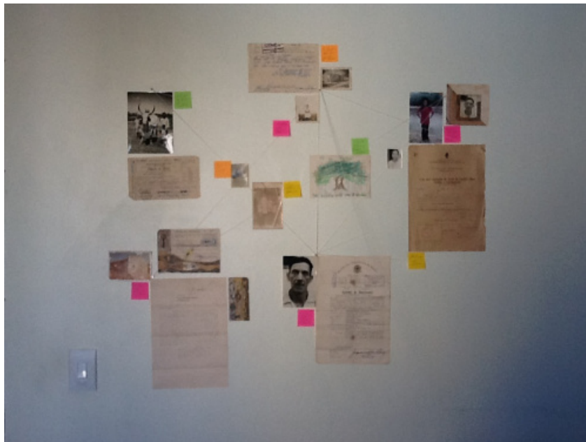
Figura 2 – Painel de visualidades onde são traçados os itinerários percorridos em parte da pesquisa.

A noção de multiplicidade deleuziana é realizada através de agenciamentos que “vão na contra-corrente da estabilização, da solificação, da estratificação” (SILVA, 2004, p. 38). Em meu processo de doutoramento, as várias possibilidades de encontros desencadeados por minha pesquisa, acabaram criando itinerários. Buscando visualizar o conjunto de vias abertas por esses encontros, reuni fotografias, documentos, desenhos, observações e os organizei em uma coleção de visualidades montadas em uma parede da minha casa (Figura 2). Uma montagem por onde pude conectar pessoas a lugares, lugares a histórias, histórias a imagens, imagens a ideias, dúvidas, descobertas e toda sorte de vislumbres.