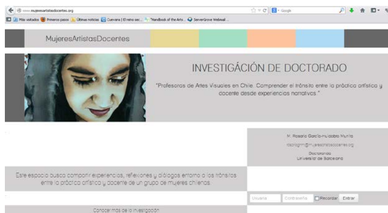
Figura.01 Portada plataforma virtual MujeresArtistasDocentes

Esta plataforma surgió desde la necesidad, como investigadora, de comenzar a acercarme a la vida y experiencia de las cuatro profesoras que conformarían mi investigación. Como investigadora interesada en comprender relatos de experiencia en la vida cotidiana, no podía permitirme tantos meses leyendo textos teóricos sobre estas nociones, y quizás simplemente porque las experiencias que quería escuchar, ver y comprender estaban a miles de kilómetros. En esos momentos, la distancia se me presentó como un problema porque yo estaba viviendo en Barcelona y ellas en Santiago de Chile. Sabiendo que el trabajo de entrevistas presenciales y acompañamiento a sus prácticas docentes comenzaría en unos nueve meses más, comencé a pensar estrategias que me permitieran acercarme a ellas, comenzar a conocerlas y escuchar sus experiencias. Así fue como llegué a la idea de crear un espacio virtual en internet. Soñé un tipo de espacio que estuviera al alcance de todas y que no fuera complicado de utilizar. Que nos permitiera reflexionar y compartir estas experiencias entre todas, sin importar dónde estuviésemos. A este espacio lo llamé MujeresArtistasDocentes 1 y lo pensé como un sitio íntimo, que nos permitiera compartir experiencias, reflexiones y diálogos entorno a nuestros tránsitos entre la práctica artística y docente.