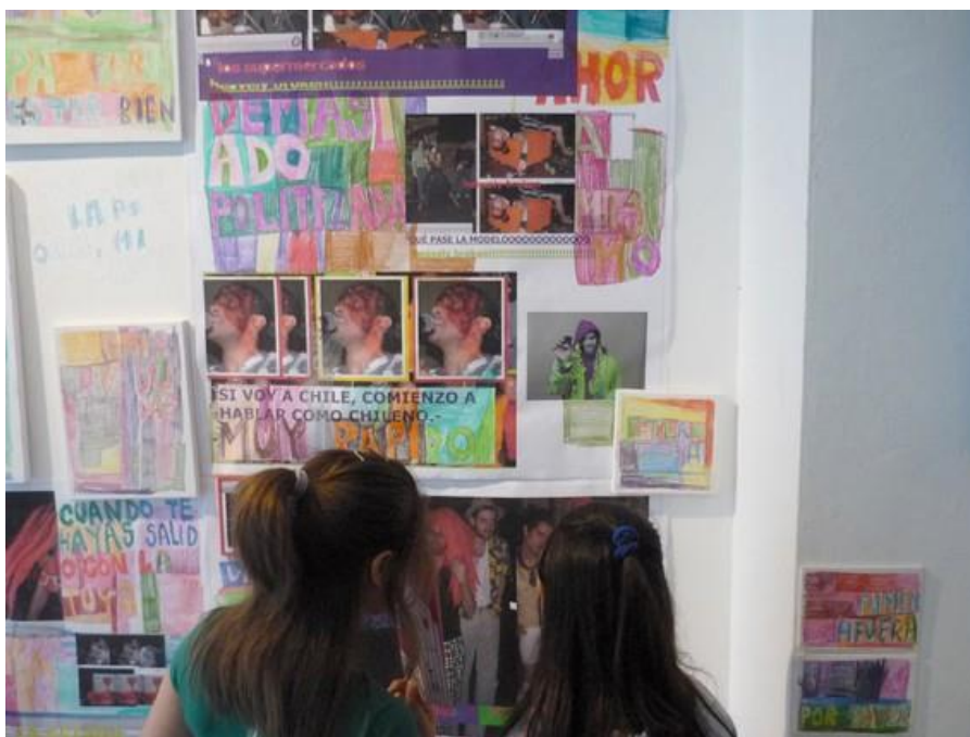
Fig. 05 - Dos niñas frente a imágenes de una exposición de Dani Umpi (2009) en la que participaron desde una experiencia educativa Centro Plataforma del MEC, Montevideo.

(e) La educación de las artes visuales y la experiencia estética no son espacios subsidiarios o transversales para la comprensión de otras disciplinas o la adquisición de conocimientos más importantes o útiles. Tal educación (y la creación y la apreciación) integra la posibilidad humana en el sentir y el hacer, es la experimentación vital de lo visual y de lo artístico, pero lo central es su trascendencia en la posibilidad comprensiva del mundo y en la acción sobre él.