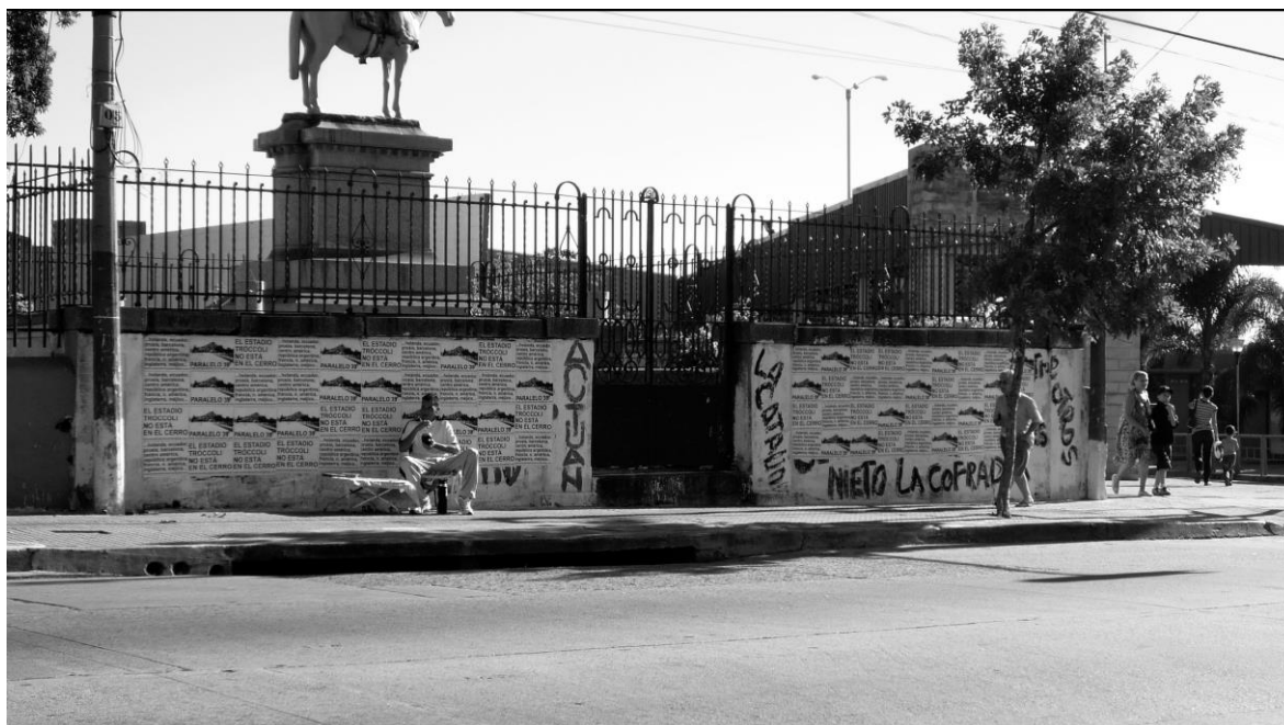
Fig. 03- Intervención del Proyecto de Investigación "Repertorios de Cultura Visual en la Ciudad de Montevideo" (2009).Fotografía: Sebastián Alonso)

Cuando centramos nuestro punto de mirada y referencia en la cultura visual consideramos la importancia de la visualidad en la época contemporánea.