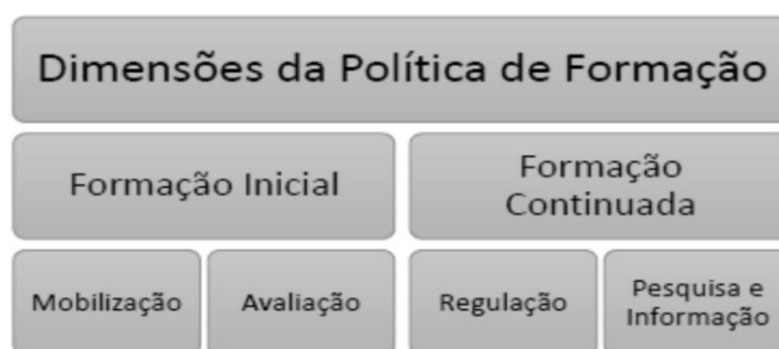
Figura 3 - Política Nacional de Formação de Professores

Responsabilizar o professor pela qualidade da aprendizagem dos alunos, promover formação inicial ou continuada, sem levar em conta primeiramente a condição sócio-histórico de extrema desigualdade e exploração que estão submetidos a maioria das pessoas nesse país, chega a ser de tão agressivo, massacrante. A figura 3 ao apresentar a política, nos chama atenção para a sua dimensão formativa: