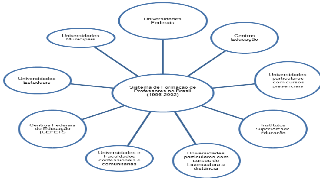
Figura 1 - Sistema de Formação de professores de 1996-2002, com ênfase no lócus.