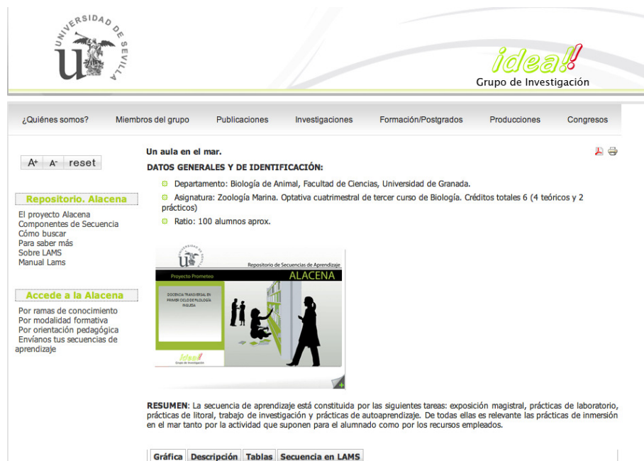
Figura 1– Alacena: Repositorio de Secuencias de Aprendizaje