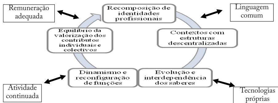
Fig. 1: Ciclo e dimensões de desenvolvimento da Profissionalidade

A profissionalidade necessita, em consequência, de se constituir como a resultante de, pelo menos, duas dimensões principais: as condições intersubjetivas da ação individual e de grupo; a existência de contextos sociopolíticos convocadores de uma ação coletiva de construção de identidades e da sua valorização, nas negociações relativas à organização e ao desenvolvimento do trabalho. No quadro da primeira dimensão, a profissionalidade reporta-se à ação profissional autónoma com características identitárias, compreendendo um compromisso ético e político com o trabalho, o desenvolvimento profissional e todos os trabalhadores, com particular destaque para os que partilham o mesmo conjunto de atividades. A segunda dimensão remete para a procura contínua de uma direção político-ideológica que assente num projeto humanista de valorização das pessoas e dos seus contributos individuais e coletivos. Nestas sociedades ninguém poderá ser apenas um trabalhador treinado para desempenhos profissionais, acríticos e adaptativos, ainda que, sob compromissos obscuros com a competitividade e a produtividade, devendo, pelo contrário, envolver-se num contrato conjunto de construção de comunidades profissionais de bem-estar comum, capazes de evoluir num acordo de procura contínua de responsabilidade e autonomia individual e coletiva.