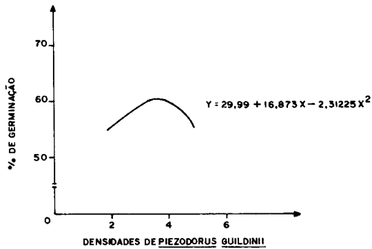
FIGURA 2. Efeito de diferentes densidades de Piezodorus guildinii , durante 14 dias, sobre a germinação de feijão cv. Rio Tibagi.