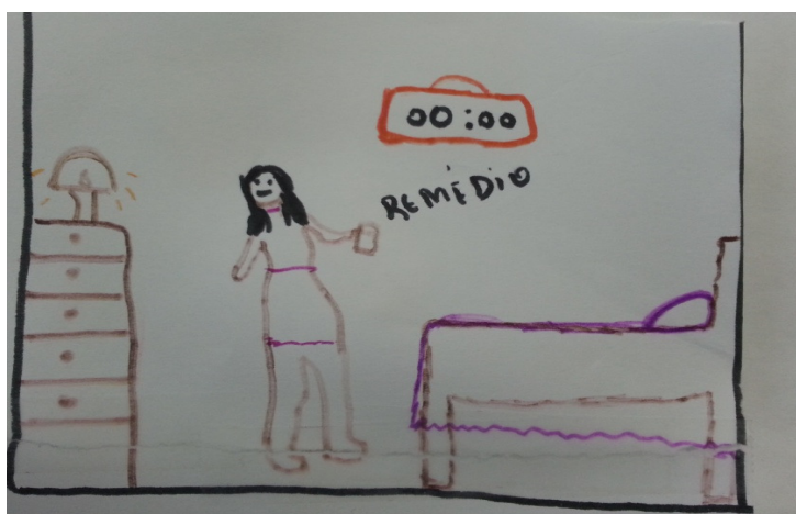
Figura 2 - Produção artística de A4.

Eu tomo [remédio], levanto, me arrumo e vou pra escola. Aí chega a noite, me dá preguiça de levantar e tomar [...]. (A8)