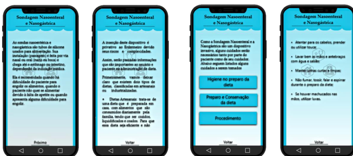
Figura 2 - Imagem ilustrativa dos submenus da Sondagem Nasoenteral e Nasogástrica.

Por meio da navegação neste submenu, o usuário contará com informações que irão auxiliá-lo, assim como a seus acompanhantes/cuidadores, no desempenho dos cuidados com o dispositivo invasivo em específico. Desta maneira, as orientações referentes à Sondagem Nasoenteral e Nasogástrica estão organizadas em formato textual e visual, existindo ainda os menus específicos: “Higiene no preparo da dieta”, “Preparo e Conservação da dieta” e “Procedimentos” (Figura 2).