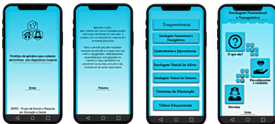
Figura 1 - Imagem ilustrativa das telas de abertura, menu principal e menu de Sondagem Nasoenteral e Nasogástrica.

Por meio da navegação neste submenu, o usuário contará com informações que irão auxiliá-lo, assim como a seus acompanhantes/cuidadores, no desempenho dos cuidados com o dispositivo invasivo em específico. Desta maneira, as orientações referentes à Sondagem Nasoenteral e Nasogástrica estão organizadas em formato textual e visual, existindo ainda os menus específicos: “Higiene no preparo da dieta”, “Preparo e Conservação da dieta” e “Procedimentos” (Figura 2).