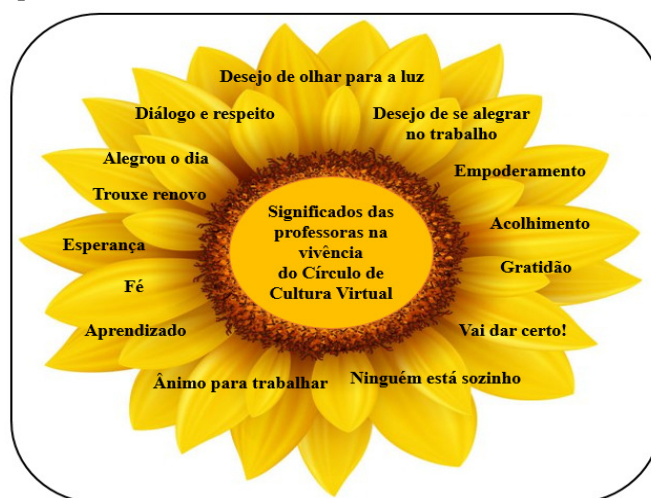
Figura 2 - Significados das professoras na vivência do Círculo de Cultura Virtual. Chapecó, SC, 2020.