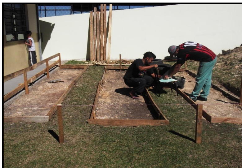
FOTO 01: PAIS CONSTRUINDO A HORTA NO CMEI PROFESSORA ODYSSEA DE OLIVEIRA HILGEMBERG

Ao longo dos meses que se passaram, os alunos puderam experimentar os sentimentos e as