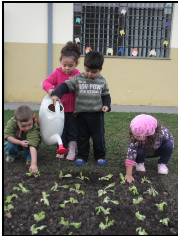
FOTO 06: PLANTIO DE MUDAS E SEMENTES