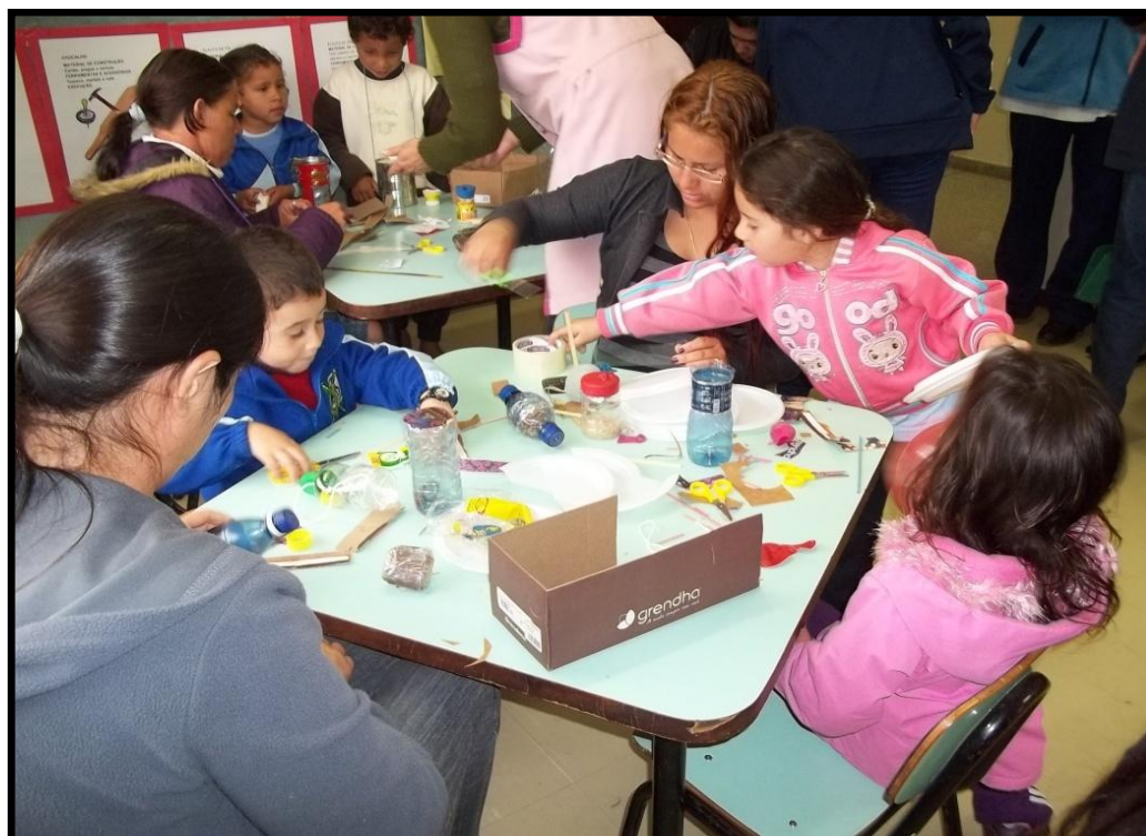
FOTO 19 : CONFECÇÃO DE INSTRUMENTOS MUSICAIS COM MATERIAL RECICLÁVEL