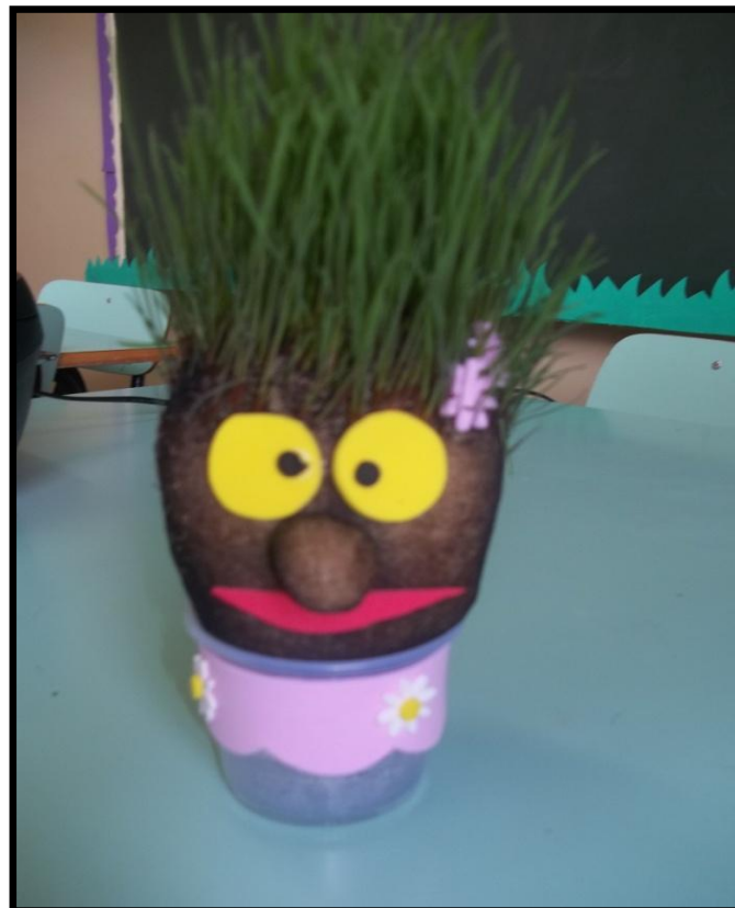
FOTO 21 : BONECO FEITO COM ALPISTE