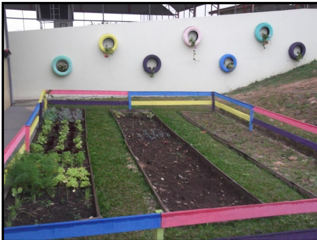
FOTO 07: HORTA PRODUZIDA COM OS ALUNOS