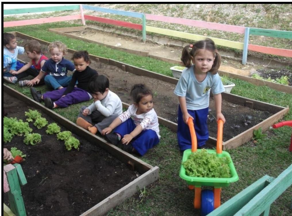
FOTO 09 :COLHEITA DE ALFACES PLANTADA PELOS ALUNOS DO INFANTIL III