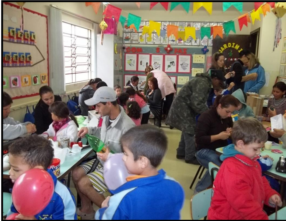
FOTO 20: PAIS E ALUNOS PRODUZEM INSTRUMENTOS MÚSICAIS COM LIXO RECICLÁVEL