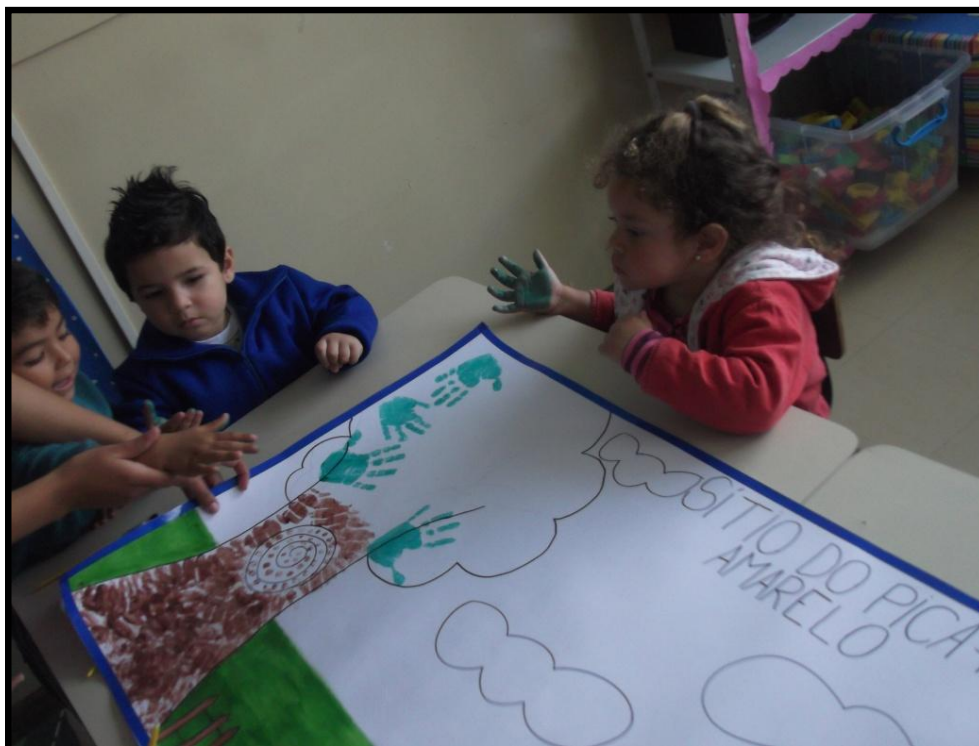
FOTO 24: O MEIO AMBIENTE E MONTEIRO LOBATO: DESCOBERTAS NO SÍTIO DO PICA PAU AMARELO

As atividades propostas pelas professoras as regentes de classe, em diferentes níveis e variações, foram realizadas partindo de itens sugeridos pelos educadores, oferecendo oportunidade de múltiplas possibilidades que enriqueceram com a criatividade e o desenvolvimento de habilidades dos alunos.