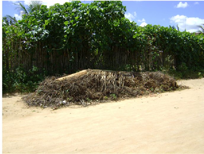
Figura 3. Lixo ao lado da cerca de uma residência