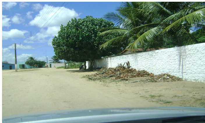
Figura 4. Entulhos jogados na rua.