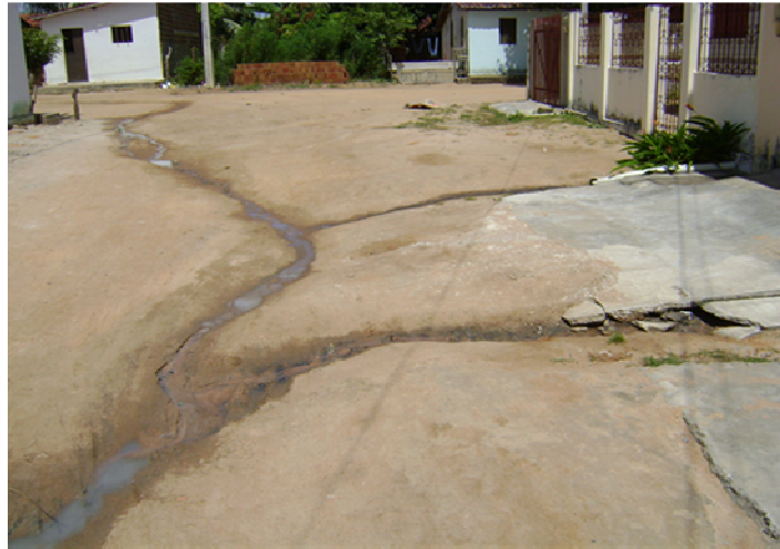
Figura 2. Valas a céu aberto.