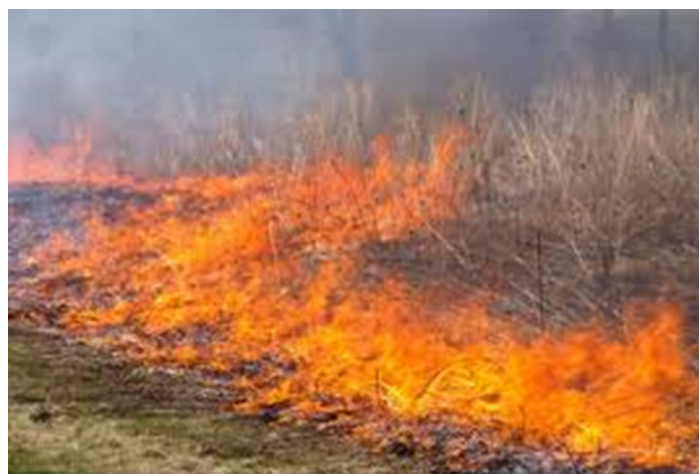
Figura 5. Queimadas praticadas por proprietários de terras

Diante de descasos com o meio ambiente, é de suma importância que todos se unam para que providências sejam tomadas no sentido de pressionar e fazer com que a máquina administrativa dos municípios façam cumprir suas obrigações e os seus serviços junto à comunidades e que cada um se conscientize da necessidade de cuidar do espaço em que vive. Para a população, principalmente a mais carente, as questões ecológicas estão associadas ao combate a poluição, coleta de lixo, agrotóxicos, desmatamentos, segurança, moradia, etc. E deve ter a adoção de uma política ambiental mais eficiente, com leis rigorosas e monitoramento ambiental permanente.