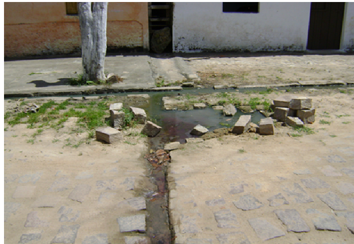
Figura 2. Esgotos em valas nas ruas.

Como podemos ver através das fotos anteriores, que os esgotos encontram-se a céu aberto, as águas correm por meio de valas. Por isso, Meireles (2001) acrescenta que poucos são os esgotos domésticos que são tratados no Brasil, sendo a maioria despejados em cursos de água: