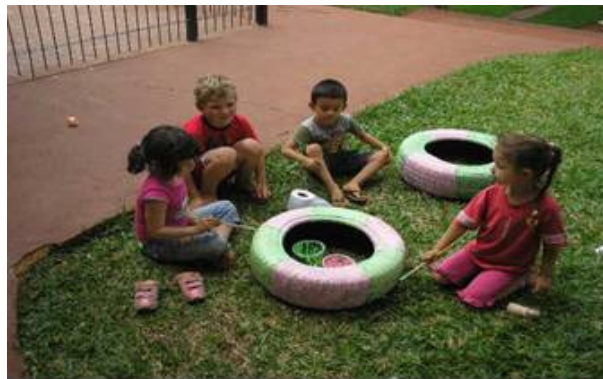
Figura 3 - Etapa de pintura dos Pneus

Muitas foram as dificuldade enfrentadas, uma foi que devido a política de prevenção da dengue os pneus foram recolhidos e mandados para fora do Município, não conseguindo encontrar pneus disponíveis e sem custo; após muito diálogo e longa procura um agricultor fez a doação de dois pneus para o jardim; então estes foram lavados e pintados pelas crianças, como mostra a figura abaixo: