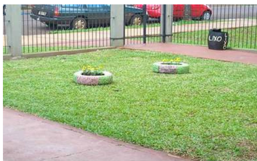
Figura 5 – Resultado Final

As crianças se divertiram com a interação, a professora Regente e equipe diretiva interferiram quando acharam necessário; escolhendo o local para o plantio.