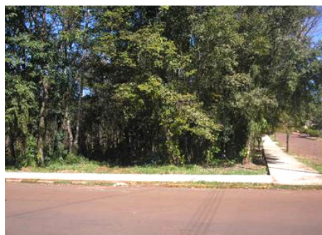
Figura 6 - Bosque próximo a EMEI

Uma semana depois do plantio do Jardim, este não era mais novidade para as crianças e o que fazer a este respeito? Muitos ajudantes do dia não regavam as flores, alguns esqueciam qual era seu dia, então fomos passear no bosque próximo a EMEI, para que as crianças refletissem sobre suas atitudes. Trabalhou-se no passeio a História, como era antes de os homens chegarem aqui, que o bosque não teve interferência humana, que as árvores, flores nasceram por conta e/ou por alguns fatores da natureza, como vento, passarinhos.