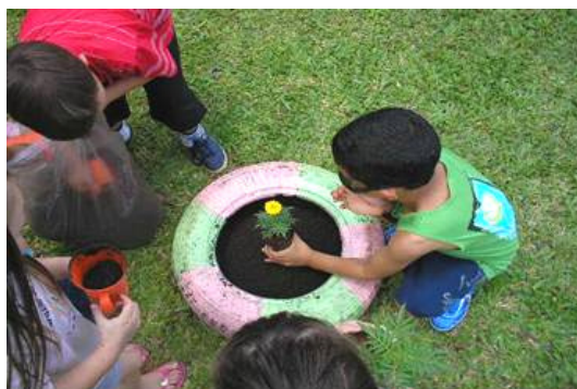
Figura 4 - Crianças executando o projeto

As crianças se divertiram com a interação, a professora Regente e equipe diretiva interferiram quando acharam necessário; escolhendo o local para o plantio.