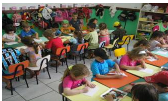
Figura 7 - Jardim I desenhando

Ao chegar na Escola pediu-se para que eles desenhassem como o meio ambiente deveria ser, e que diferenças perceberam, através de mudanças de atitudes, utilizando de diversas técnicas como desenhar com Giz molhado e desenhar com Giz de cera, dividiu-se a turma em dois grupos