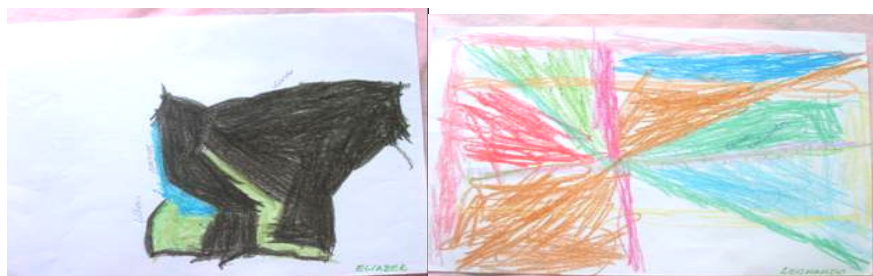
Figura 1 e 2 - Meio Ambiente (casa, canos e folhas) e Meio Ambiente (canos de esgoto)

Questiona-se o que entendem por Meio Ambiente: