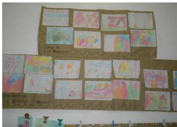
Figura 9 - Exposição dos desenhos: Passeio pelo Bosque e Adote um Jardim