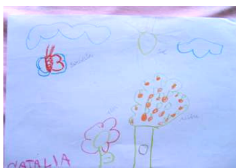
Figuras 8: Amostragem: Desenhos da natureza

Tudo indicou que o fato dos alunos perceberem diferenças entre o antes e depois; a simples prática de Educação Ambiental não foi em vão; foi colocado em exposição na escola desenhos e trabalhos dos alunos a respeito do meio ambiente e o que atitudes podem e devem tomar a respeito do Meio Ambiente.