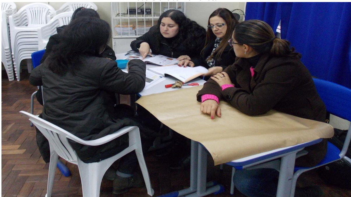
Figura 3– Construção de proposta de trabalho interdisciplinar pelos professores da área das Ciências Humanas.

Nesse sentido, o trabalho proposto é interdisciplinar, pois, os professores através dos conhecimentos das diferentes disciplinas responderam uma problemática em comum.