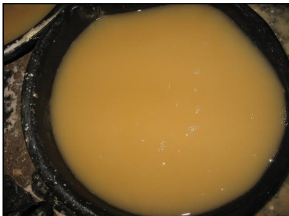
Figura 6 - Tina utilizada para coletar manipueira no processo de prensagem da massa de mandioca, Sítio Chã do Jardim, Areia, PB.

Na etapa de prensagem da massa ralada é gerado outro efluente líquido manipueira (Figura 6). A manipueira é o líquido de constituição das raízes de mandioca, que apresenta aspecto leitoso, cor amarelo-claro e odor fétido.