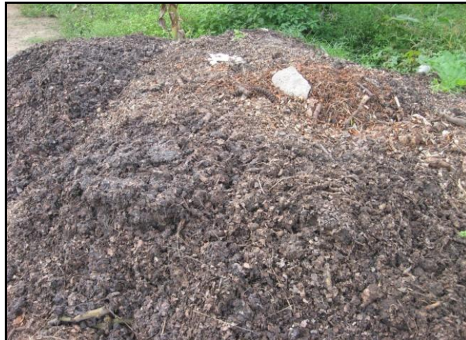
Figura 2 - Cascas e cepas geradas na etapa de raspagem das raízes.

Com as cascas saem certas quantidades de solo utilizado no processo mecanizado de raspagem das raízes, entrecasca e pedaços de raízes que ocasionam perdas no processo.