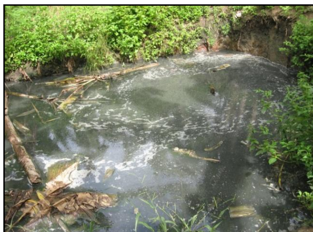
Figura 5 - Armazenamento do efluente líquido gerado no processo de lavagem das raízes de mandioca, Sítio Chã do Jardim, Areia/PB.

A Figura 5 ilustra o local de armazenamento da água de lavagem das raízes de mandioca que corresponde ao efluente gerado no lavador – descascador.