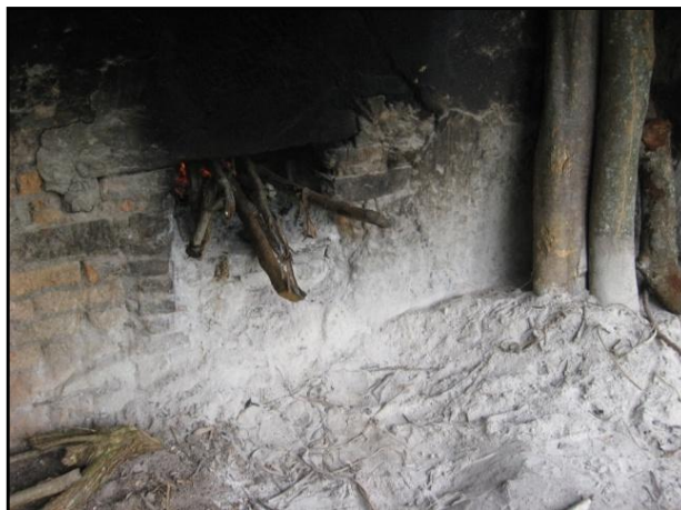
Figura 4 - Cinzas provenientes da queima de lenha no processo de torração da massa prensada, na casa de farinha, Sítio Chã do Jardim, Areia/PB.

No processo de torração da farinha utilizam-se lenha (Figura 4), que através de sua queima gera energia calorífica. Como este material é bastante rico em minerais também poderá ser utilizado sozinho na adubação ou incorporado aos demais resíduos do processo para a produção de um composto mais eficaz. Para a casa de farinha estudada, não foi possível estimar a quantidade gerada deste material, pois ele poderá variar em conformidade com o tipo de vegetal utilizado e estágio de queima do mesmo.