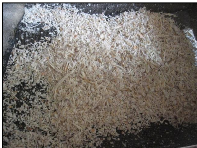
Figura 3 - Peneira com crueira de raízes de mandioca retidas.

As crueiras são pedaços de fibras e entrecasca das raízes de mandioca (Figura 3), que são separados por peneiramento antes, da torração da massa prensada. Foi encontrado 15,9 kg t -1 de crueira por tonelada de raízes processada. Este valor foi significativamente baixo, quando comparado com o citado por Cereda (2001b), pois de acordo com a autora, uma tonelada de raiz produz em média 42 kg de crueira.