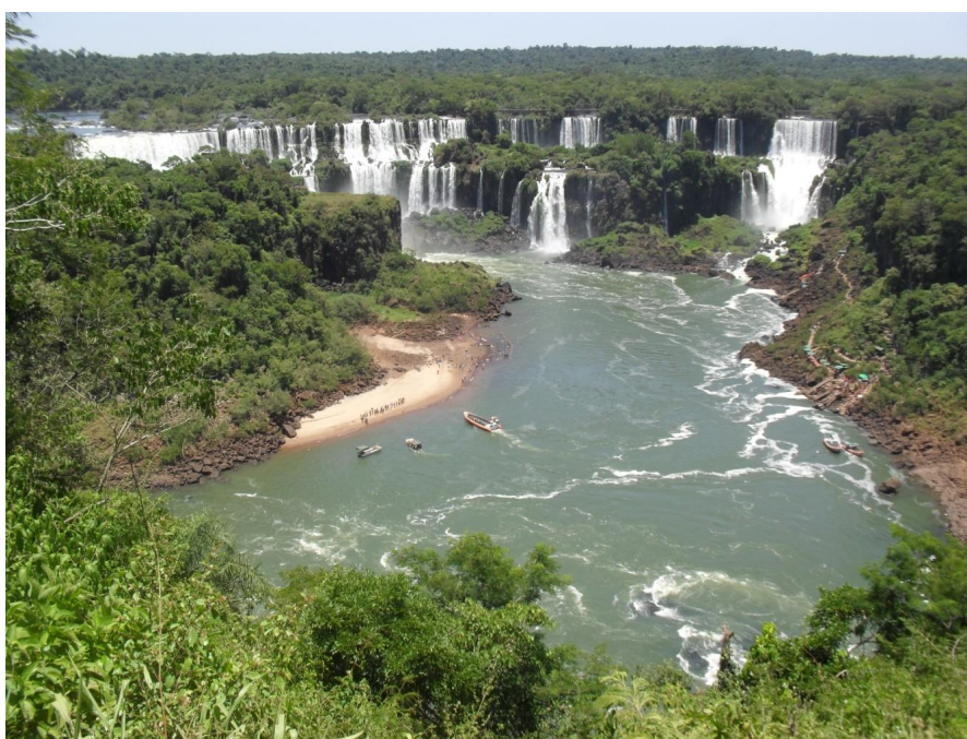
Figura 3. Cataratas do Iguaçu - Imagem lembrada pelos moradores

Os entrevistados foram questionados sobre as paisagens agradáveis e desagradáveis encontradas no bairro onde residem. O lixo nas ruas e em terrenos baldios foram os problemas mais citados, sendo causados pelos vizinhos e moradores que precisam ser conscientizados sobre suas ações. As favelas e invasões também foram citadas por mais de 7% dos entrevistados, como problema ambiental presente no bairro onde residiam. Contudo, com relação as paisagens que trazem algum prazer para os moradores, mais de 40% não consegue visualizar nenhuma paisagem no bairro onde moram.