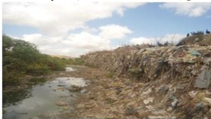
Figura 8 – Encontro do Chorume com o Riacho.

Devido ao descarte incorreto dos resíduos, o chorume, resultante de sua decomposição, causa grandes impactos ao meioambiente, afetando rios, solo e lençóis freáticos. No lixão em estudo, a produção de chorume é visível (figura 8).