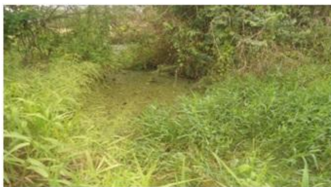
Figura 12 – Riacho dos Macacos depois do lixão

É difícil acreditar que, no Riacho dos Macacos, as pessoas se banhavam e pescavam. Hoje, encontra-se “recheado” de toneladas de lixo. Essa realidade é mais uma prova de que a qualidade dos recursos hídricos está cada vez mais ameaçada pela poluição dos resíduos. O nosso país tem grande quantidade de água doce, porém ameaçadas e impróprias para os diversos tipos de consumo humano. Observa-se que o Riacho dos Macacos, a cinco metros depois do lixão, quase não dá para ser visto em meio aos matagais (figura 12).