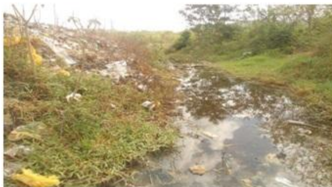
Figura 7 – A proximidade do riacho dos macacos com o lixão.

Vale ressaltar que o lixo, produzido diariamente nas cidades e descartado sem nenhum tratamento, prejudica diretamente a qualidade de vida da população e traz mudanças ao meio ambiente, pois o mesmo é depositado em lugares indevidos e sem nenhum tipo de tratamento. Na maioria das vezes, esses lugares escolhidos para descartes de resíduos sólidos são áreas próximas das cidades, geralmente nas encostas de rios, próximos de matas ciliares e de residências. Neste estudo, o lixão encontra-se localizado nas proximidades do riacho dos macacos (figura 7).