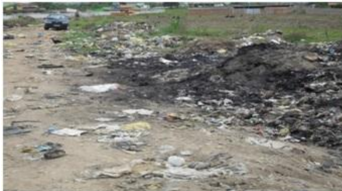
Figura 9- Queima espontânea do lixo

Também foi detectada a queima espontânea do lixo, que pode prejudicar a saúde dos catadores e da população que reside nas proximidades (figura 9).