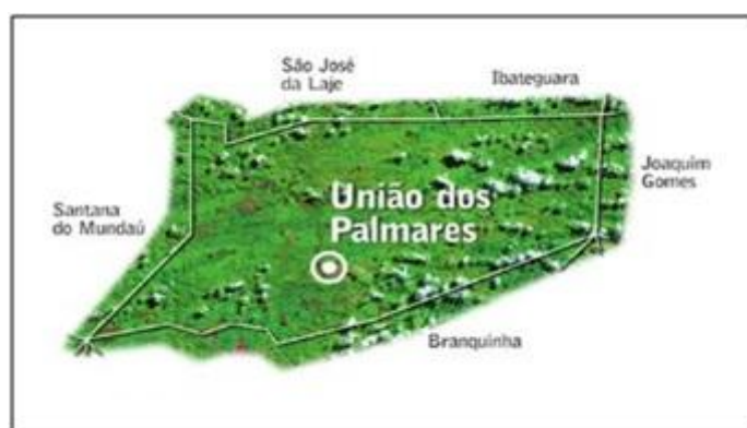
Figura 1 – Mapa da localização de União dos Palmares-AL

O município de União dos Palmares está localizado na Mesorregião do Leste Alagoano e na Microrregião Geográfica Serrana dos Quilombos, fazendo limites, ao norte, com São José da Laje e Ibateguara; ao sul, com Branquinha; a leste, com Joaquim Gomes e, a oeste, com Santana do Mundaú, como se observa na figura 1. Tem uma área de 420,658 Km 2 , situado nas coordenadas geográficas na latitude 09°09'46" e longitude 36° 01'55"0, na parte norte-oriental do Estado de Alagoas, (IBGE 2010).