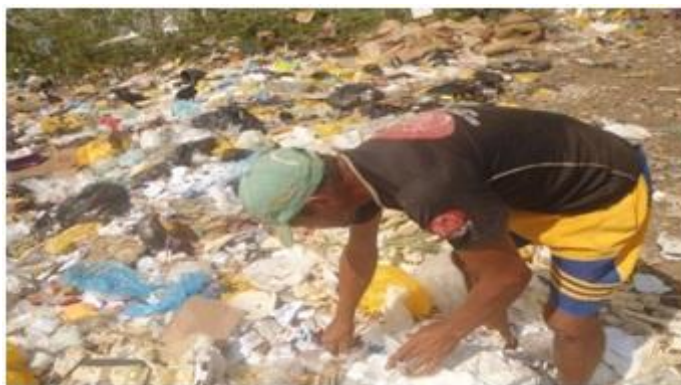
Figura 3 – Catador no lixão

O Brasil é um país de grandes contrastes sociais. Os mais frequentes são a violência, o desemprego, a educação e a saúde. Para que esses contrastes possam ocorrer, depende de outros fatores que estão relacionados, tais como a distribuição de renda feita no país, que é desigual. Enquanto uma pequena parte da sociedade é muito rica, a maior parte da população vive na pobreza e na miséria. Pode-se visualizar esse fato aos catadores de materiais recicláveis, uma vez que ficam em situações de vulnerabilidade nesse ambiente de trabalho, expostos a vários tipos de contaminação e doenças (figura 3).