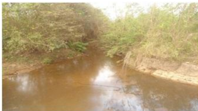
Figura 10 – Riacho dos Macacos, antes do lixão