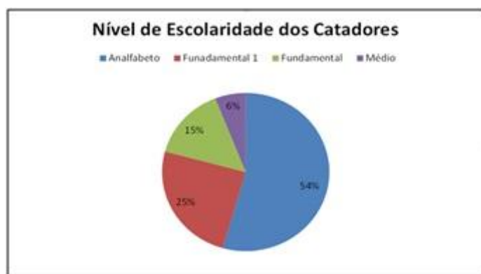
Figura4 – Nível de Escolaridade dos Catadores

Com o intuito de conhecer melhor os problemas sociais dos catadores, elaborou-se perguntas de ordem pessoal do ambiente de trabalho: o lixão. Destas 19 pessoas, 26% afirmaram ser do sexo feminino e 74% afirmaram ser do sexo masculino, ficando evidente que a grande maioria dos trabalhadores é do sexo masculino. A pesquisa também avaliou o nível de escolaridade dos catadores (figura 4).