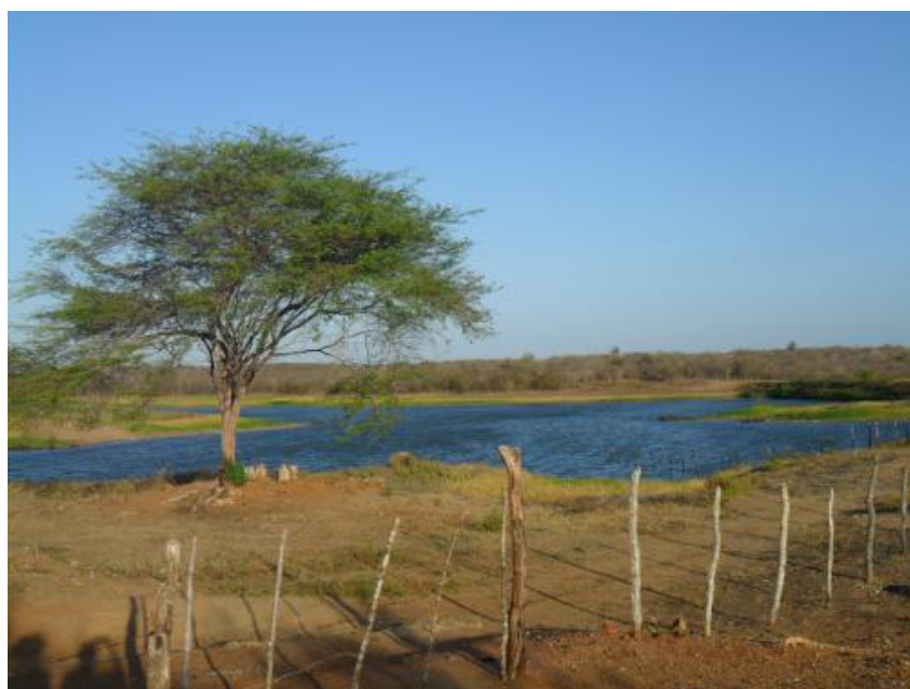
Figura 3. Açude na porção sul da área. Algaroba à esquerda.

A área de estudada é composta por vegetação mais espaçada, tornando-se mais denso na região nordeste. Além disso, devido à área apresentar um reservatório artificial de água (açude) na região norte e outro a sudeste (Figura 3), a