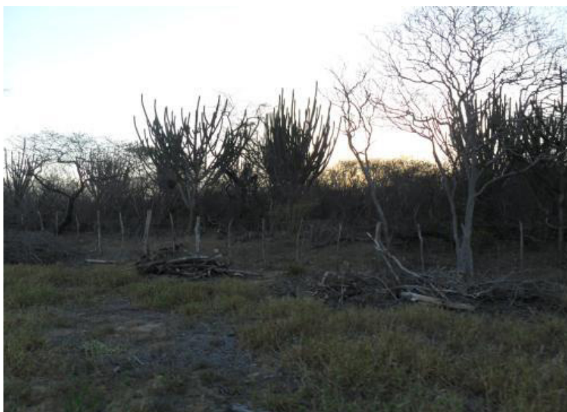
Figura 7. Presença do facheiro ( Pilosocereus pachycladus Ritter)