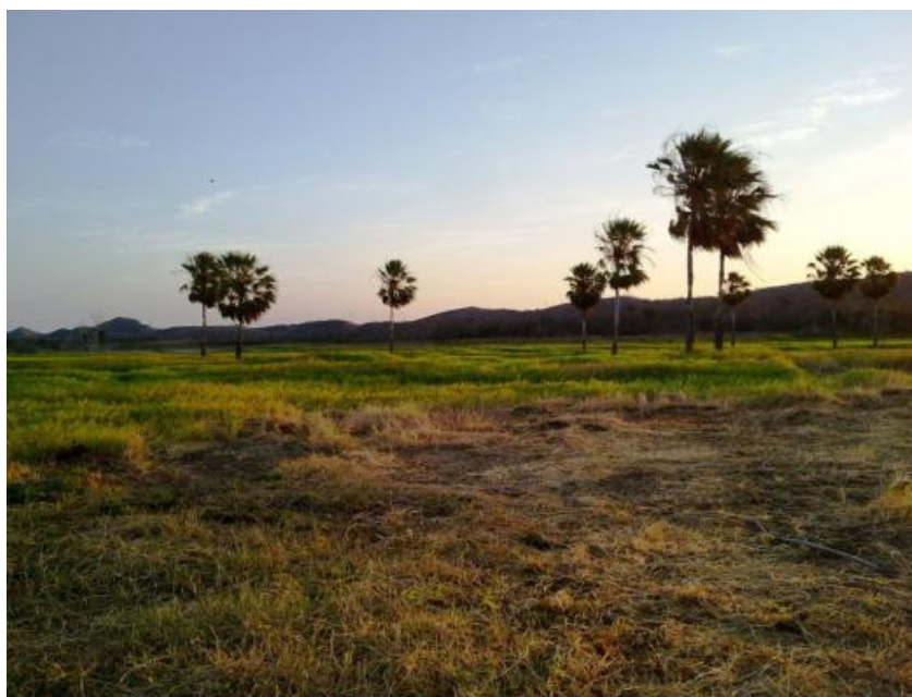
Figura 4. Carnaúbas ( Copernicia prunifera (Mill.) H.E.Moore) presentes na região de estudo

vegetação nesses locais em específico apresenta configuração herbácea, com presença de gramíneas, Carnaúbas ( Copernicia prunifera (Mill.) H.E.Moore (Figura 4) e coqueiros ( Cocos nucifera L. – Figura 5). A presença de espécimes vegetais pioneiras como o Velame ( Croton campestris A. St.-Hil) e espécies exóticas como a Algaroba ( Prosopis juliflora (Sw.) DC.) e o Aveloz ( Euphorbia tirucalli L.) são indicadores de ação antrópica principalmente marcada pela extração de lenha e pastagem livre de gado. Ainda assim, a vegetação