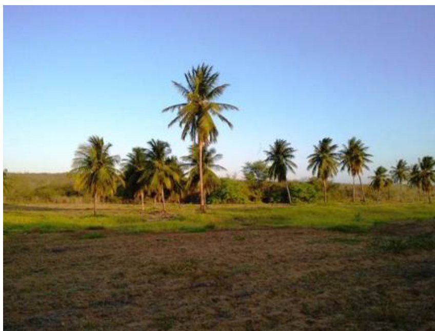
Figura 5. Coqueiros ( Cocos nucifera L.) presentes na região de estudo.

As espécies arbóreas típicas da caatinga são representadas pela Catingueira ( Poincianella pyramidalis (Tul.) L.P. Queiroz), Jurema-preta ( Mimosa tenuiflora (Willd.) Poir.), pelo Juazeiro ( Ziziphus joazeiro Mart.), além das cactáceas como o Mandacaru ( Cereus jamacaru DC), o Facheiro ( Pilosocereus pachycladus Ritter – Figura 7). Outras cactáceas pertencentes ao estrato herbáceo e arbustivo como o Xique-xique ( Pilosocereus sp.), a