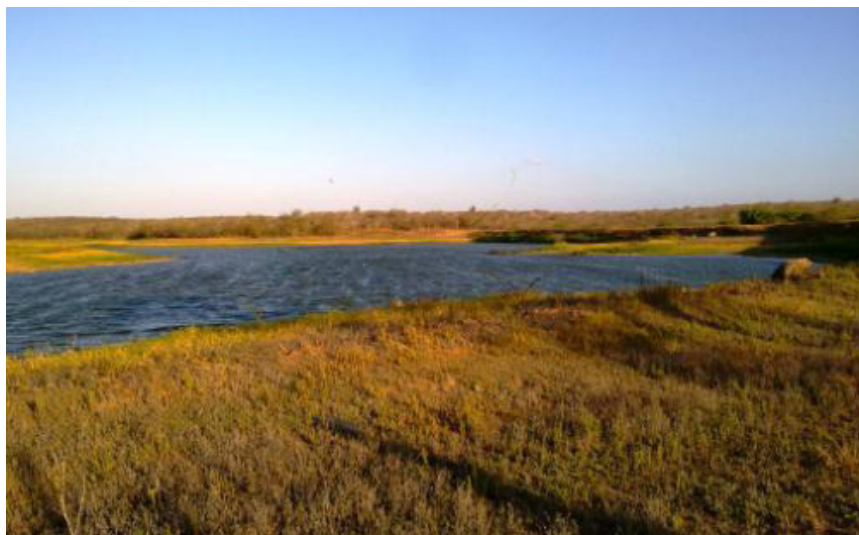
Figura 9. Localizado a sudoeste da região estudada.