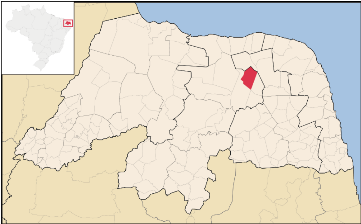
Figura 1. Mapa de localização do município de Pedra Preta/RN.

Ainda assim, há algumas áreas na AID que se encontra com vegetação característica de caatinga hiperxerófila e com relativa densidade. Ainda que a vegetação tenha sido observada praticamente ausente de folhas devido ao período de estiagem, foi possível identificar algumas espécies nativas como a Catingueira ( Poincianella pyramidalis (Tul.) L.P.