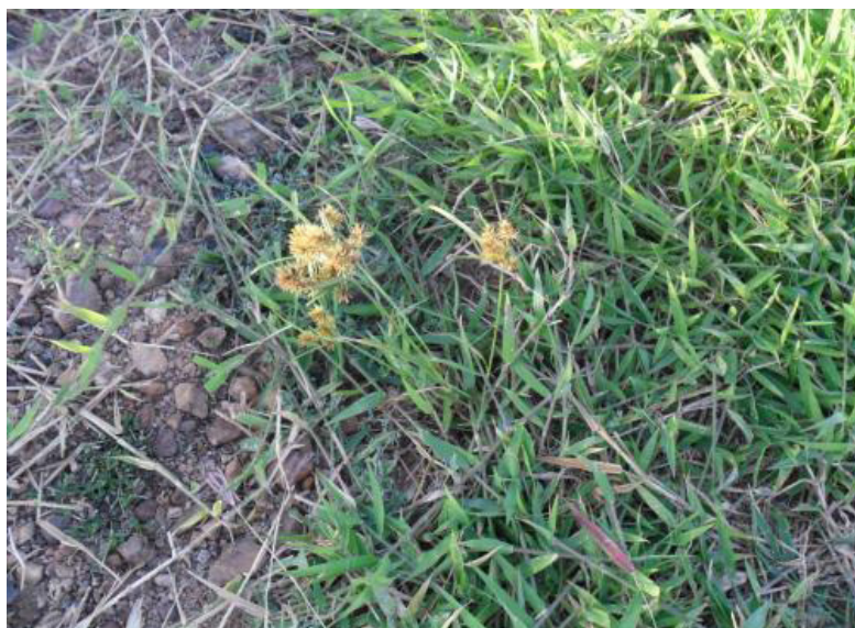
Figura 10. Ciperácea compondo vegetação herbácea