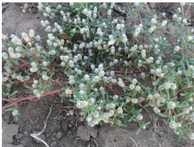
Figura 11. Bredinho ( Blutaparon portulacoides (A. St-Hil) Mears).