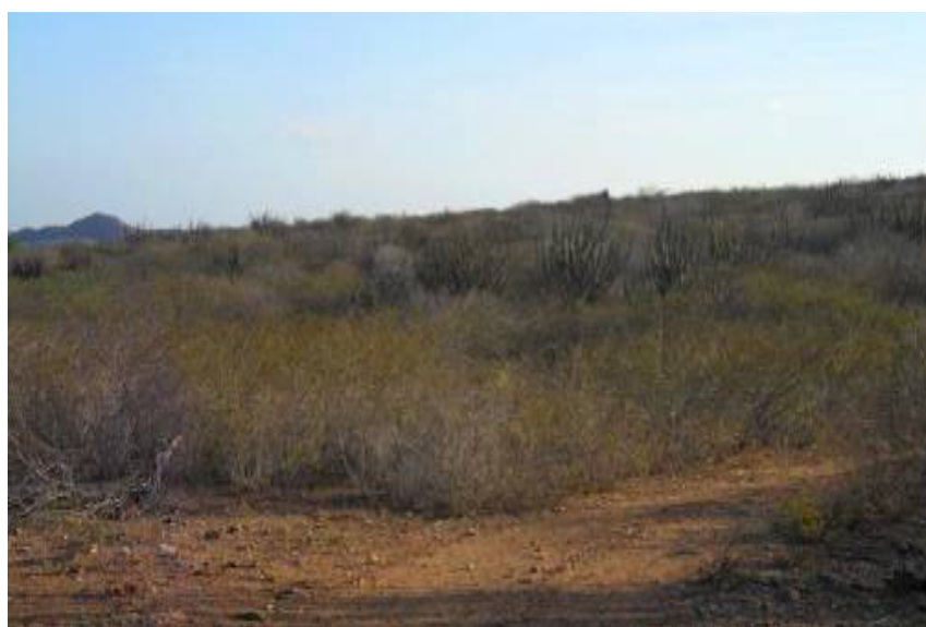
Figura 8. Estrato arbustivo com muita presença de cactáceas.