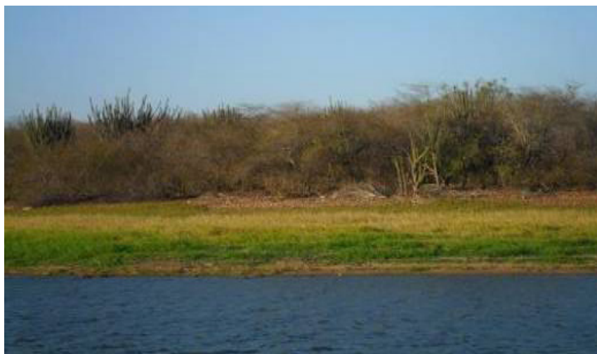
Figura 6. Vegetação arbustivo-arbórea próxima ao açude.