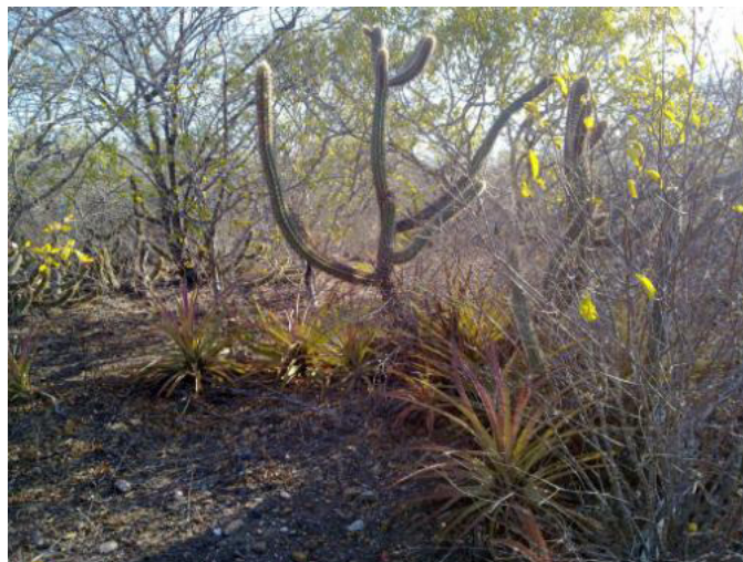
Figura 2. Bromeliáceas e Cactáceas compoendo a vegetação típica do bioma.

Queiroz), a Imburana ( Commiphora leptophloeos (Mart.) J.B. Gillett) e Jurema ( Mimosa sp.).