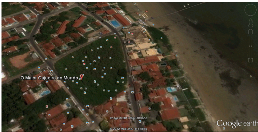
Figura 2. Cajueiro de Pirangi: vista aérea.