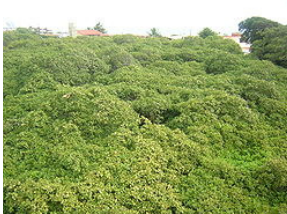
Figura 1. Cajueiro de Pirangi.

Na Figura 1 é apresentada uma imagem do local estudado. Bem como, na Figura 2 uma vista área da referida área e sua influência.