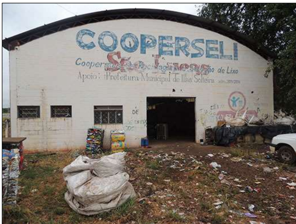
Figura 2 - Cooperativa de reciclaje de Ilha Solteira, São Paulo