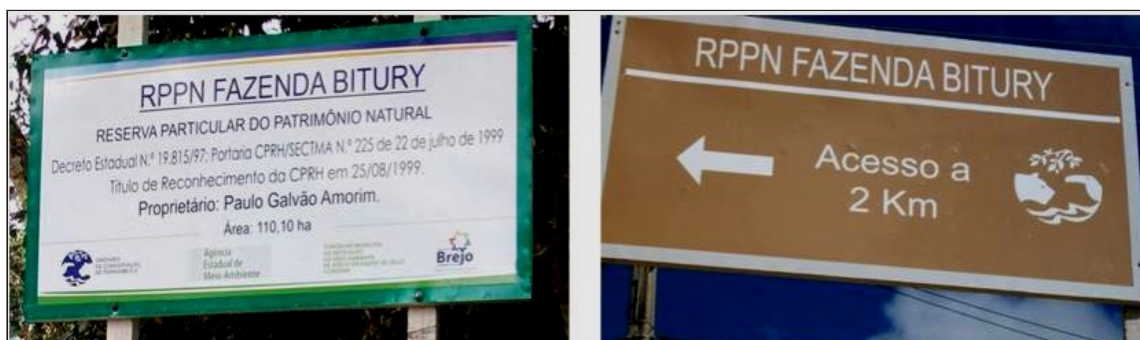
Figura 2 - Señalización de RPPN viabilizada por el FMMA de Brejo da Madre de Deus