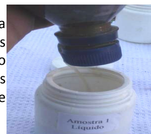
Figura 5 – Retirada da água infiltrada através do solo.

Cada amostra de solo recebe 100 mL de água da chuva. A água infiltra-se pelo solo, é recolhida e analisada (Figura 5). Nesse caso os parâmetros são: Presença de cloro, cloretos, ferro, fosfato, nitrogênio (amônia). Dureza total, pH, transparência e oxigênio dissolvido. Os dados são tabelados para comparação com parâmetros de potabilidade no que se refere a aplicabilidade da água.