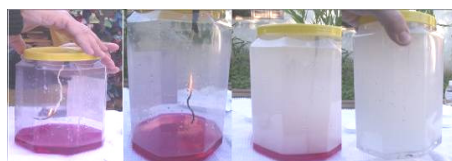
Figura 4 - Simulação da chuva ácida.

Um efeito visual adicional pode ser a simulação de um lago, colocando-se água com soda ou amoníaco e fenolftaleína dentro da redoma. O efeito de “desaparecimento” da cor será mais uma prova da acidificação provocada pela queima do enxofre (Figura 4). A água acidificada (sem o efeito da soda que causará neutralização) pode ser usada para acidificar uma amostra de solo.