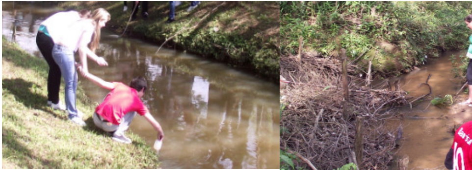
Figura 1 - Coleta de água na parte não canalizada no arroio Sapiranga.