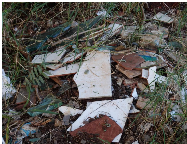
Figura 5 – Resíduos da construção civil: azulejos e vidros

Na Figura 6, observa-se a presença de outros resíduos como peças de armário, sofá, papelão e madeira.