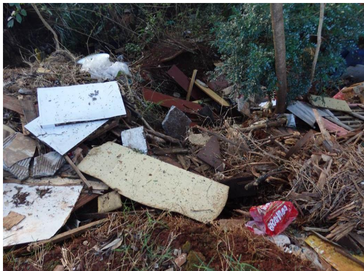
Figura 6 – Resíduos sólidos encontrados na área de estudo