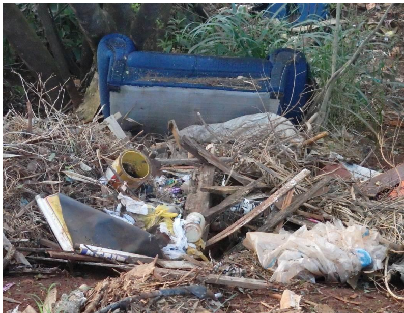
Figura 4 – Resíduos sólidos presentes no local de estudo: móveis, lata de tinta, plásticos, dentre outros Fonte: Autor, 2015

Na Figura 5, observam-se os resíduos da construção civil: fragmentos de azulejo e vidro. Os resíduos da construção civil devem ser adequadamente dispostos, de acordo com a Resolução n° 307/2002 do CONAMA (Ministério do Meio Ambiente, 2002), que estabelece diretrizes, critérios e procedimentos para a gestão dos resíduos da construção civil. Em seu artigo 4°, § 1, essa Resolução estabelece que “Os resíduos da construção civil não poderão ser dispostos em aterros de resíduos domiciliares, em área de bota-fora, em encostas e corpos d’água, lotes vagos e em áreas protegidas por Lei [...]”.