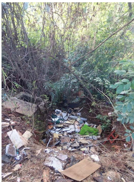
Figura 7 – Resíduos sólidos encontrados na área de estudo e erosão do local

Na Figura 7, destaca-se ainda a presença da região erodida.