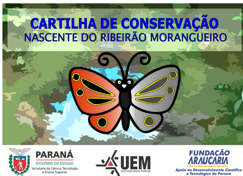
Figura 8 – Capa da cartilha de conservação ambiental

O material foi intitulado: “CARTILHA DE CONSERVAÇÃO: NASCENTE DO RIBEIRÃO MORANGUEIRO”, sendo que seu público-alvo são estudantes infanto-juvenis. A capa da Cartilha pode ser observada na Figura 8.