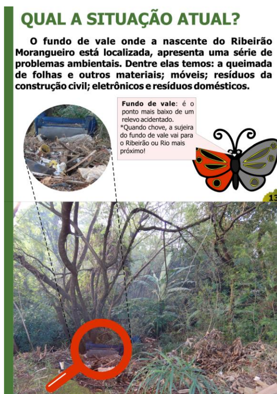
Figura 9 – Páginas 13 e 14 da cartilha de conservação ambiental