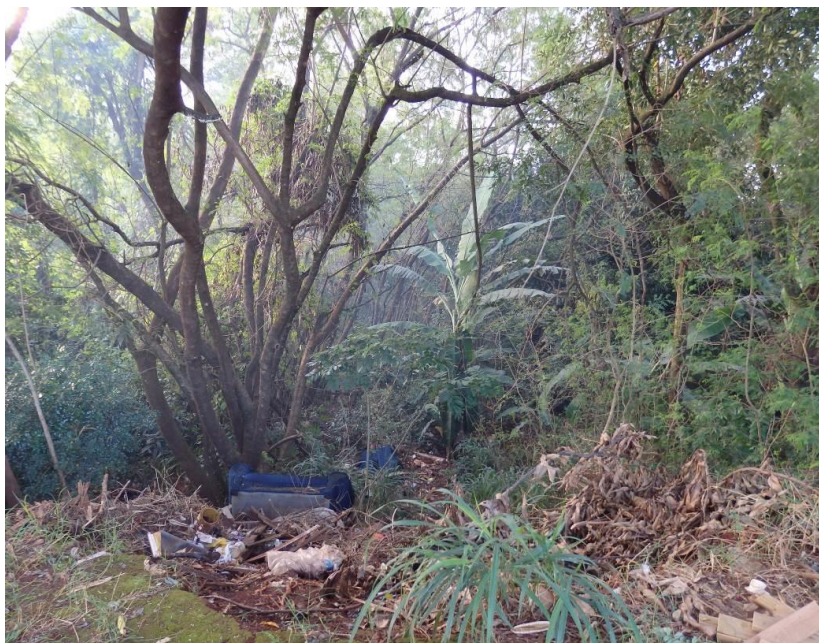
Figura 3 – Presença de fumaça, indicando queimada

Na Figura 3, pode-se observar a presença de fumaça na parte baixa do fundo de vale, representando um risco de que este fogo se alastre na região, além de desproteger o entorno da nascente do ribeirão Morangueiro. Além da fumaça, pode-se observar uma grande concentração de resíduos sólidos.