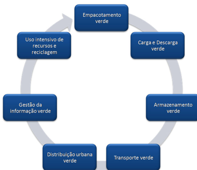
Figura 4 – Os elementos que integram uma logística verde.

Na Figura 4 são apresentados os elementos que integram uma cadeia logística verde para facilitar e explicitar os locais nos quais as empresas interessadas precisam agir para conseguir resultados.