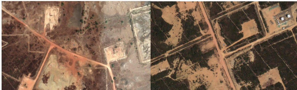
Foto 04: Imagem Google Earth (Canto do Amaro) - podemos observar pelas cores vermelho e cinza uma maior degradação do solo na região.