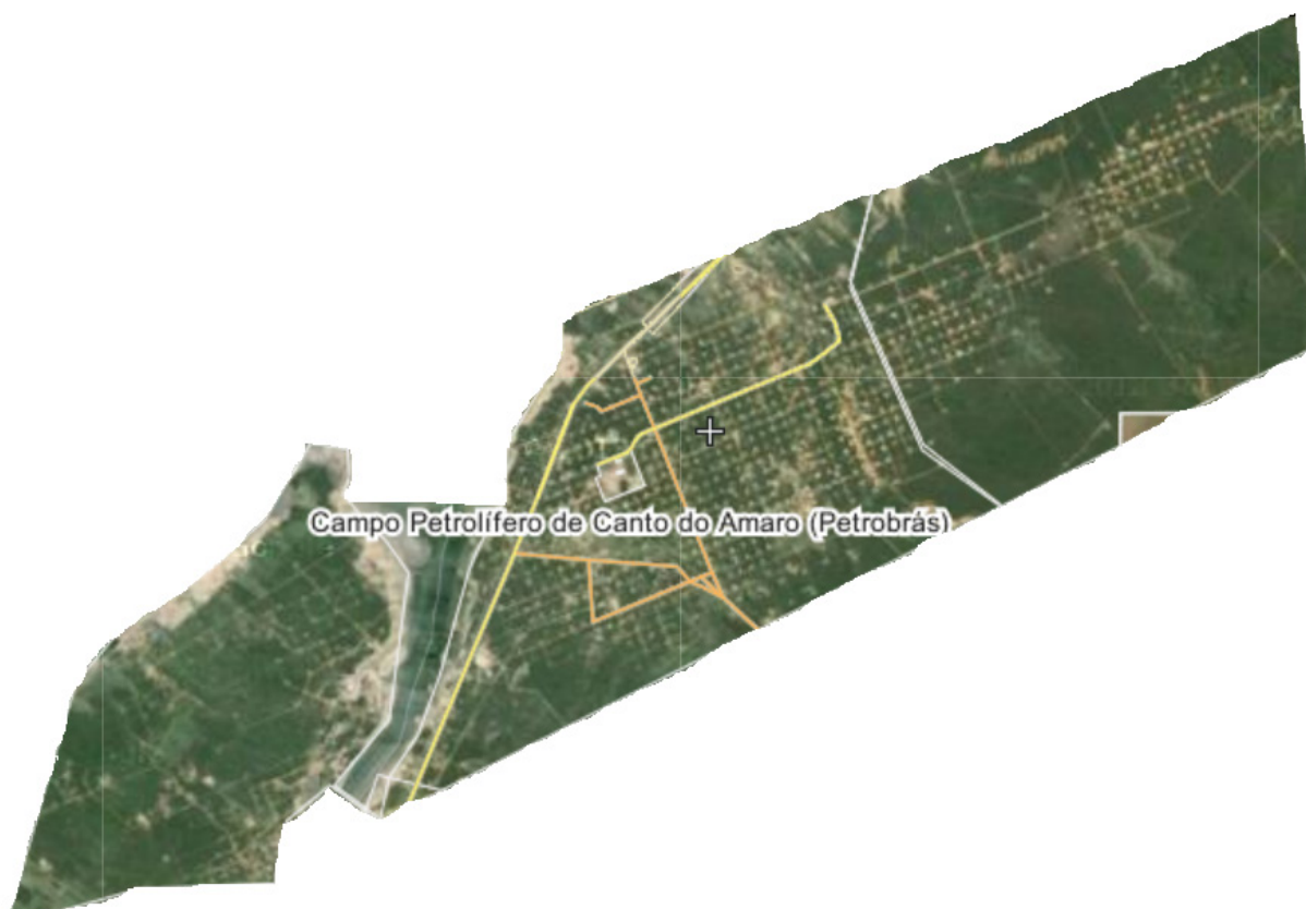
Foto 03: – Imagem Google Earth (Canto do Amaro) - mostra para toda a área, desenvolvimento de uma vegetação mais ou menos densa, com poucas áreas de solos expostos.

A avaliação da degradação das terras na região do campo petrolífero Canto do Amaro foi realizada a partir de imagens Google Earth. A imagem Google Earth (Figura 3) mostra que em boa parte da área de estudo se desenvolve uma vegetação mais ou menos densa, principalmente na porção centro nordeste. As áreas de solo expostos estão representadas por tons claros.