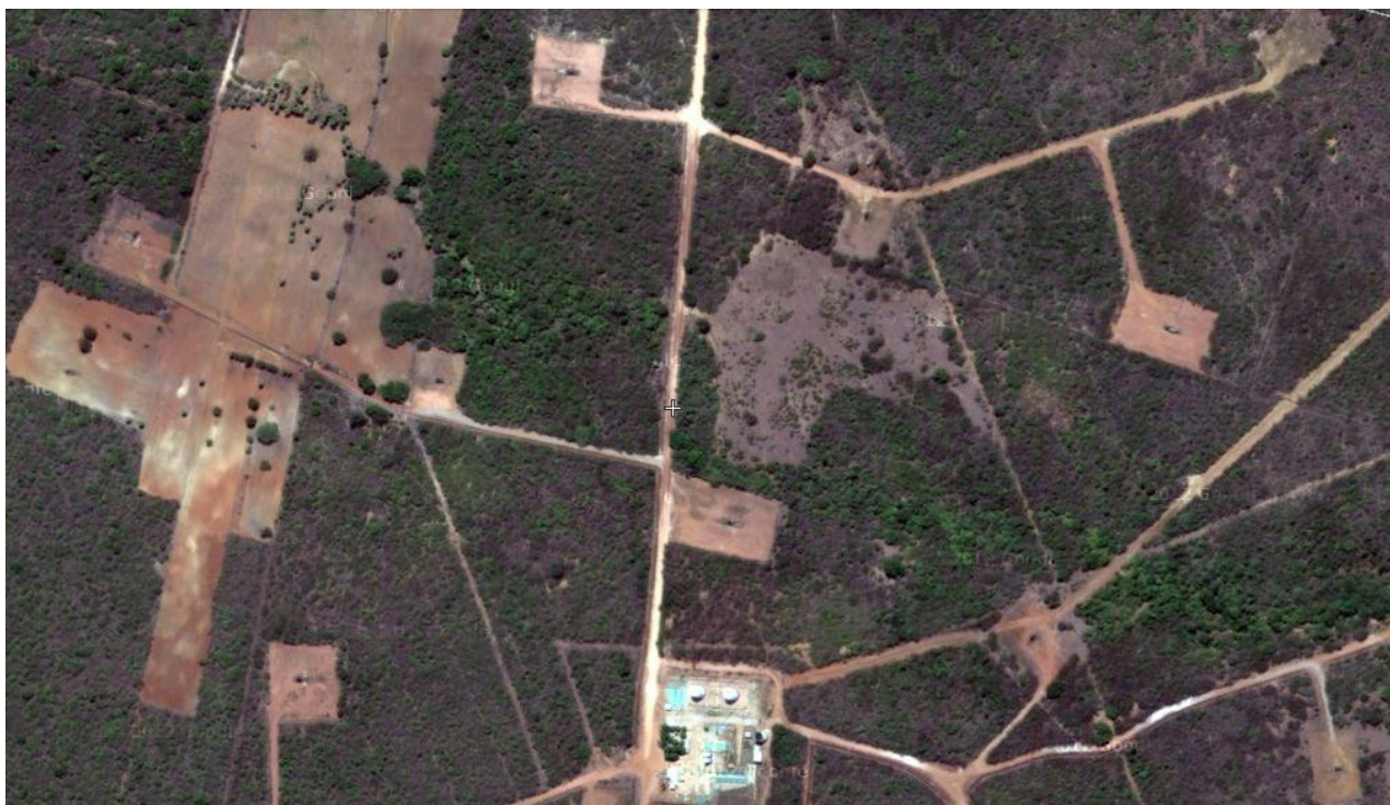
Foto 07: Imagem Google Earth (Poços de perfuração de petróleo) - realçou uma diferenciação da vegetação.