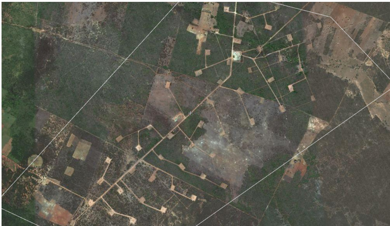
Foto 06: Imagem Google Earth (Poços de perfuração de petróleo) - realçou a localização dos poços, as estradas e áreas de erosão dos solos dentro do campo.