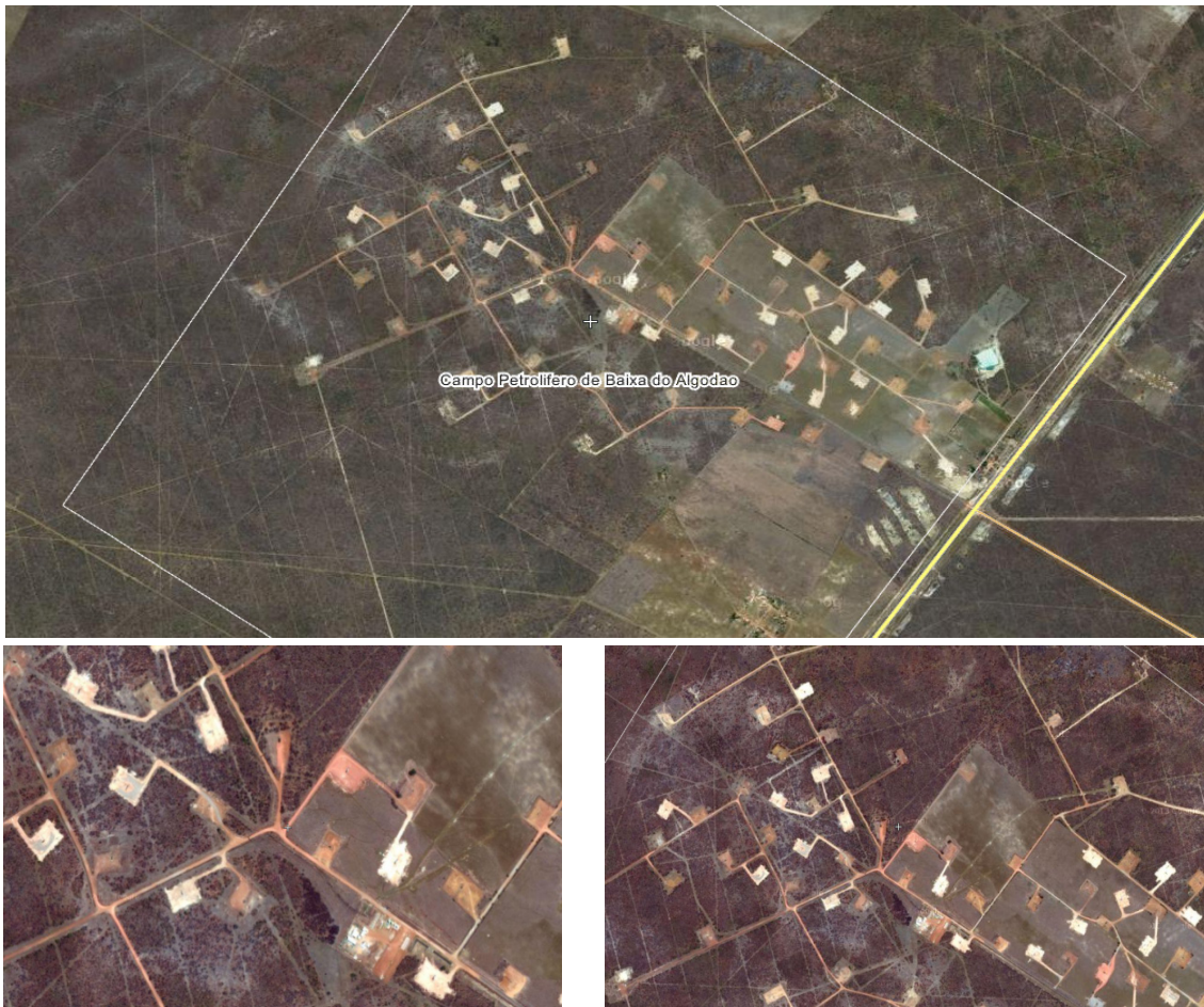
Foto 02: Imagem Google Earth (Campo Petrolífero de Baixa do Algodão) - Da área do Campo petrolífero de baixa do algodão, evidenciando as fortes áreas de exploração de petróleo. Nos quadros fotos ampliadas, visualizando impactos ambientais observados na área de exploração de petróleo.

Apesar do desenvolvimento observado na região, as atividades econômicas desenvolvidas nas proximidades dos corpos d'água vêm acarretando transformações na paisagem estuarina. Os mangues, definidos como área de preservação permanente por legislação ambiental nacional, após a implantação das salinas há mais de 50 anos, foram devastados e, hoje grande parte dessas áreas encontram-se ocupadas pelos viveiros de camarão. A área de caatinga, começa a ser ocupada também pela atividade da carcinicultura e principalmente pelo petróleo. Conseqüentemente a utilização de agrotóxicos nas áreas agricultáveis de fruticultura e o comprometimento do aquífero pelo uso descontrolado da água; a exploração intensiva pela Petrobrás com desmatamento indiscriminado, vazamentos de óleo, enterro de refugos sem o menor cuidado ambiental e lançamento de dejetos no Rio Mossoró, vêm contaminando vastas áreas e degradando o ambiente estuarino e favorecendo o processo de desertificação. 15