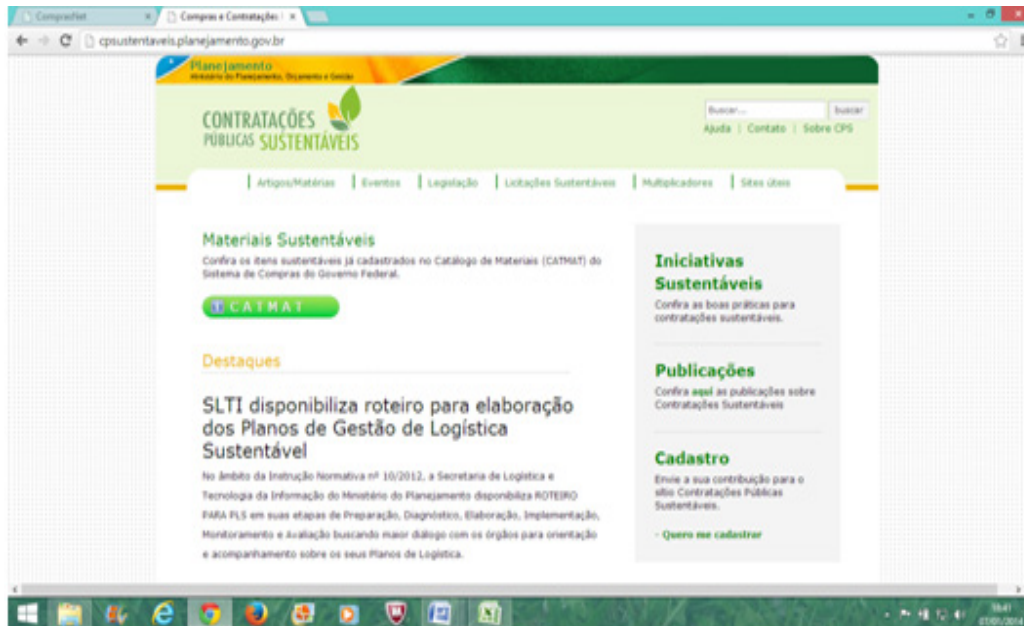
Figura 3. Página virtual - Contratações Públicas Sustentáveis

Foram analisadas as licitações sustentáveis informadas em COMPRASNET (2013), qual possui uma área específica para as contratações verdes do governo federal, denominada “Contratações Públicas Sustentáveis”, conforme mostra a Figura 3.