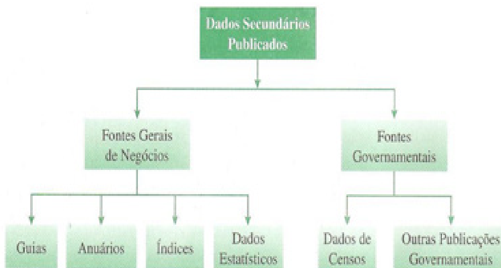
Figura 2. Características das fontes dos dados secundários

A base de dados da pesquisa configurou-se em dados secundários cujas características podem ser verificadas na Figura 2.