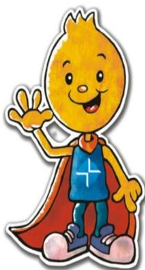
Figura 1 – Husminho – mascote da educação em saúde das áreas pediátricas do Husm.

Nos últimos dez anos, coordenei 10 projetos de extensão, incluindo organização de cursos e eventos (estes serão descritos na seção 8 deste memorial) e ações de educação em saúde com a população. A seguir, apresento a relação dos três projetos de extensão de ações de educação em saúde com a população que coordenei nos últimos dez anos.