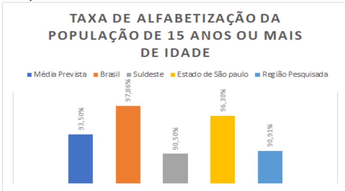
Gráfico 2 - Descrição das esferas federadas do Indicador 9A.