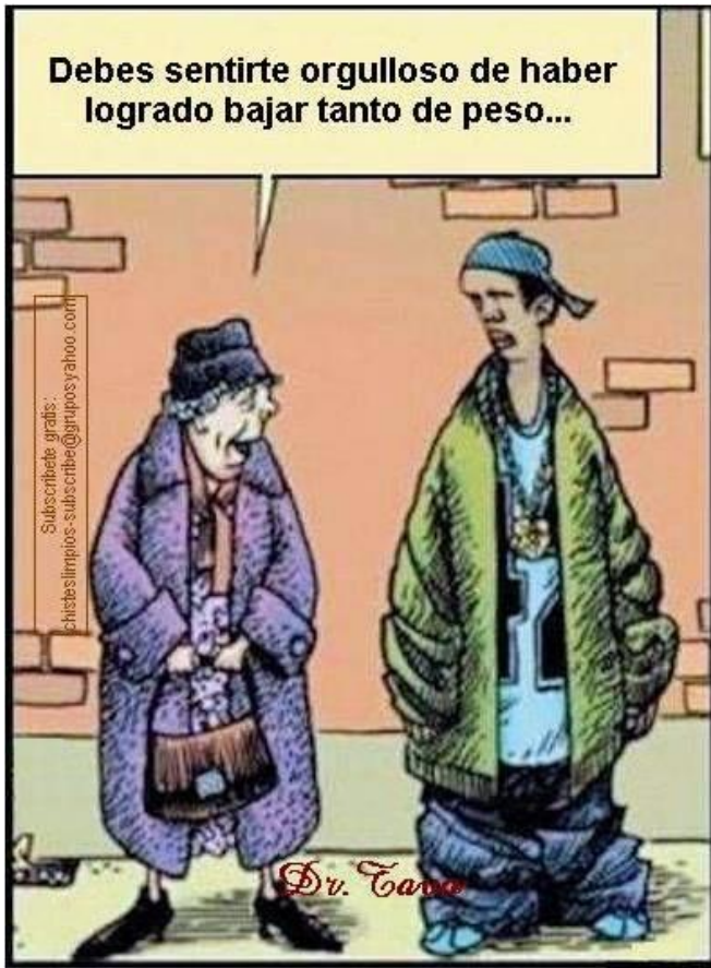
Imagem 2 Vestimentas.

De acordo com os comentários dos jovens existem significados diferentes entre os pontos de vistas das diferentes gerações, ou seja, a forma de vestir-se representa uma cultura em um determinado recorte de tempo e a compreensão desse significado cultural diverge entre os tempos de um indivíduo e de outro. Isso fica claro quando se analisa as frases dos jovens: “O mundo mudou muito desde a época dos nossos avós” ou então “é uma questão de costume, a senhora não está acostumada com roupas diferentes, para ela isso significa outra coisa que para ele”. O que identifica mudança e significado.