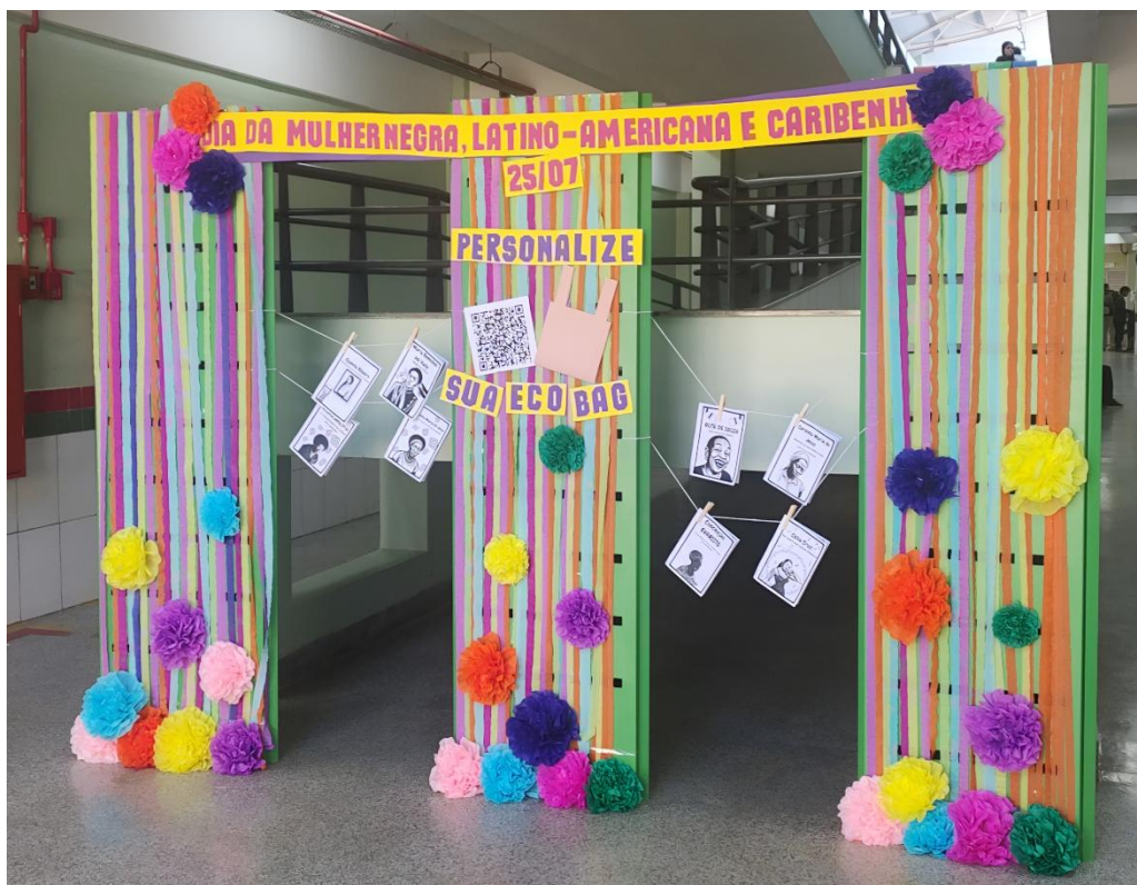
Figura 1 - Mural em homenagem ao Dia da Mulher Negra Latino-americana e Caribenha.