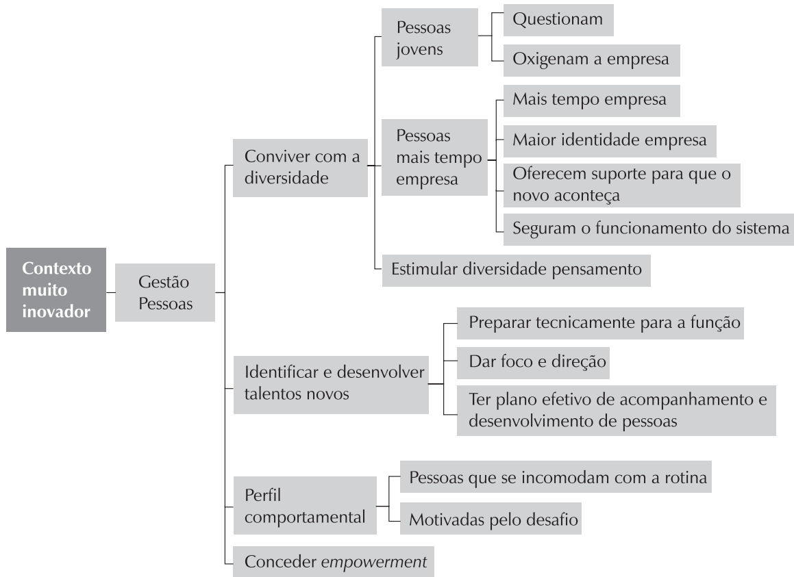
Figura 2 – Concepções gestão de pessoas na percepção de gestores inseridos no contexto muito inovador.

Os gestores integrantes da empresa considerada menos inovadora (B), por sua vez, enfatizaram a importância de se ter um perfil apropriado à inovação. Nesse sentido, dois grupos de características podem ser identificados.