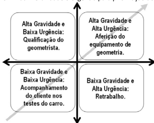
Figura 3 – Matriz Gravidade e Urgência para priorização de ações.

Os problemas foram priorizados de acordo com a combinação dos critérios gravidade e urgência (conforme Figura 3). Como houve a contratação de profissionais com maior nível de qualificação, após a primeira análise realizada através da metodologia FMEA, os esforços concentraram-se no acompanhamento do cliente, quando possível, nos testes do veículo após a prestação do serviço de geometria. Percebeu-se que a alta urgência verificada em relação ao retrabalho diminuiria consideravelmente se o geometrista fosse responsável pela realização dos testes no veículo após o serviço e se, além disso, o cliente estivesse presente neste momento. O principal problema elencado pela metodologia GUT foi a aferição do equipamento de geometria. Diante disso, a organização optou por agendar uma verificação quinzenal e se necessária uma aferição semanal, realizada pelo próprio operador (que recebeu treinamento).